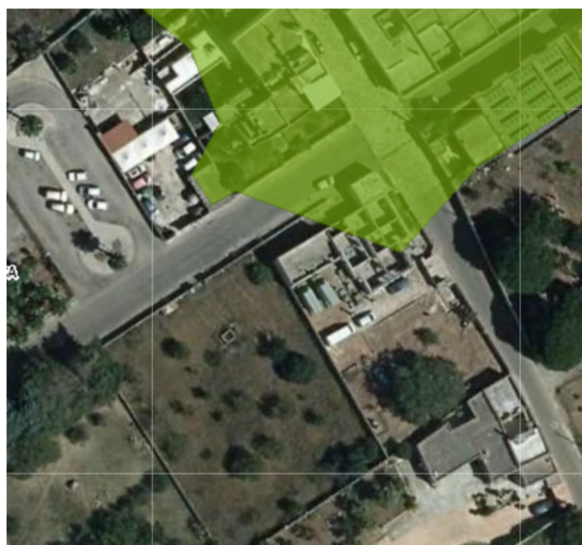
AREA DI INTERVENTO SU STRALCIO DEL P.P.T.R. PUGLIA - f.s. - aggiornato al 2020