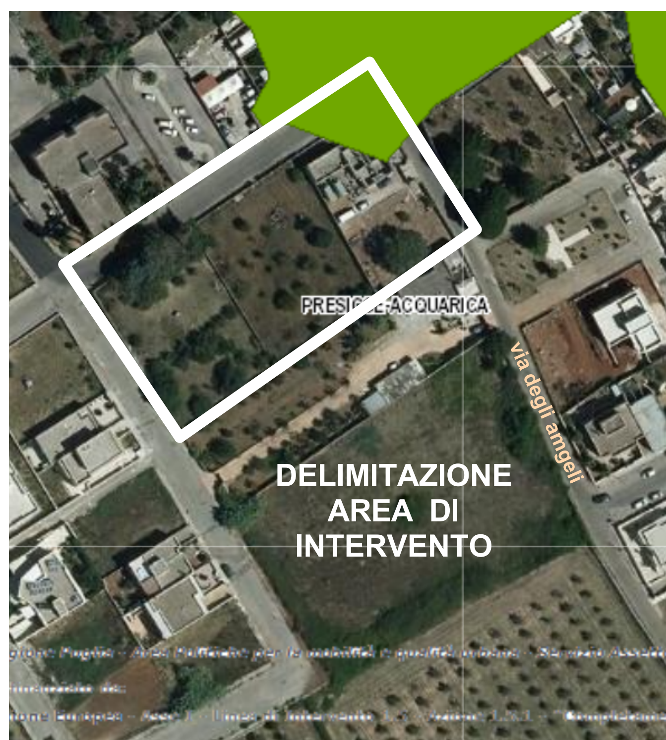
DELIMITAZIONE AREA DI INTERVENTO SU STRALCIO DEL P.P.T.R. PUGLIA - f.s. - aggiornato al 2020