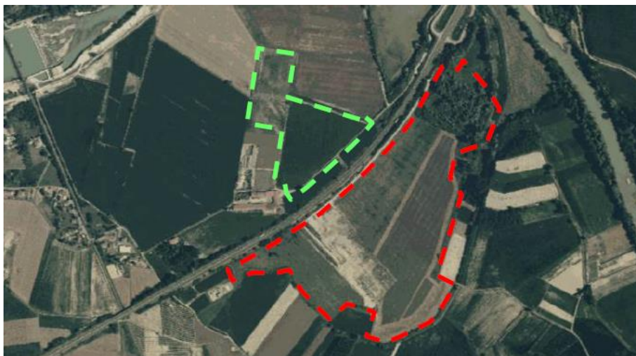
Ambito territoriale – Fonte Relazione tecnica

La zona che si intende scavare è alquanto discosta dalle abitazioni vicine, trovandosi in un'area decisamente marginale rispetto al centro abitato di Asti, le cui propaggini sono poste circa 1,5 km a Nord-Ovest, sulla sponda idrografica opposta del f. Tanaro.