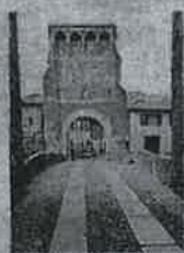
Il ponte di San Rocco