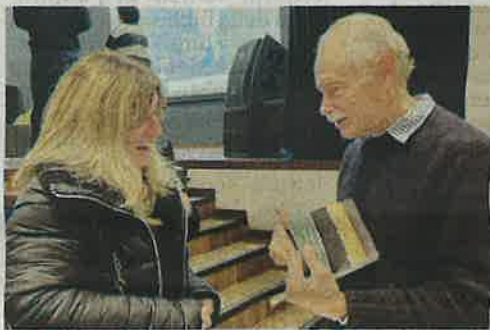
Alcuni momenti dell'incontro domenica mattina con Erri De Luca.