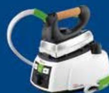
Stirella da 39€

Via XXV Aprile, 74 - LESMO (MB) | ☎ 339 6956816 - 039 5151458 |