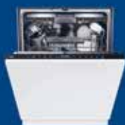
Lavastoviglie da 249€ (inverter)