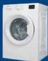
Lavatrice da 249€ (classe A)