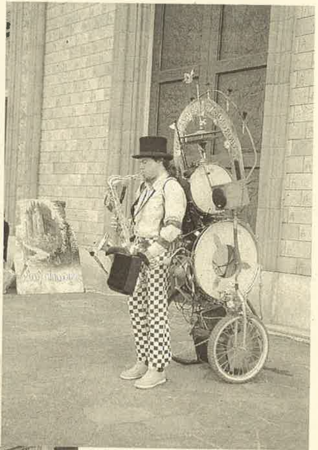
Nelle foto di questa pagina alcuni momenti della Festa di San Martino dell'8 novembre scorso

Grande successo ha riscosso sabato 7 la X rassegna di Cori polifonici "Verglatum '98", presso la Chiesa parrocchiale San Martino di Vergiate, con la partecipazione del