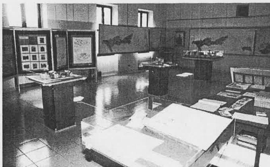
Un'immagine della mostra

ci ha portato a fare una prima valutazione della consistenza dei diversi usi degli edifici esistenti, sia di quelli che, secondo il vigente Piano regolatore, appartengono al centro storico, che di quelli al di fuori di esso, ma che sono strettamente connessi al contesto architettonico e ambientale che caratterizza la frazione. Buona parte degli edifici, tra i quali cascine e rustici che si trovano nel centro storico, risultano non adibiti ad alcun uso, in particolare la residenza, pur essendo meritevoli di restauro e di recupero.