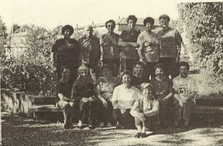
Foto di gruppo per le signore dei gruppi (scusate il bisticcio...) della ginnastica di mantenimento.

Anzi, foto di gruppi (ci risiamo!), perchè le foto sono tre: a sinistra vediamo il gruppo di Cuirone, qui a fianco quello di Corgeno, sopra quello di Vergiate