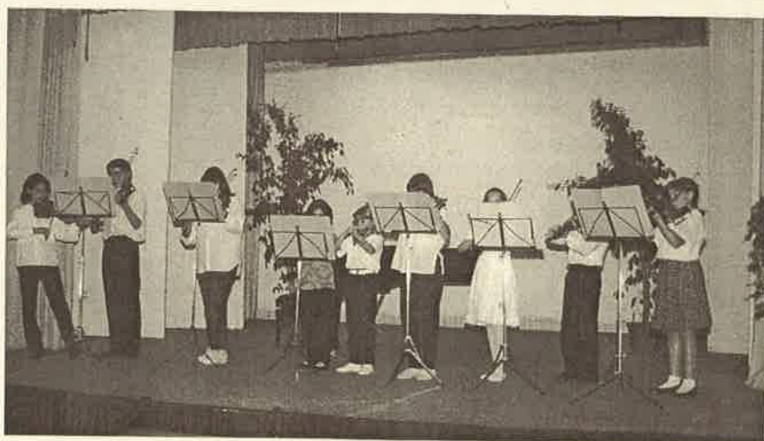
Due momenti dei saggi musicali di fine anno

all'anno scolastico 1997-98 può rivolgersi, a partire da martedì 2 settembre, tutti i giorni dalle 15 alle 19 presso la nuova sede dell'Accademia musicale "Vivaldi" in via Mercallo 36 (tel. 0331/946346). In occasione dell'inaugurazione della nuova sede si terrà, sabato 13 settembre, il tradizionale Concerto d'estate, presso il giardino del ristorante "La Cinzianella", a partire dalle 21, con la partecipazione dei docenti dell'Accademia "Vivaldi".