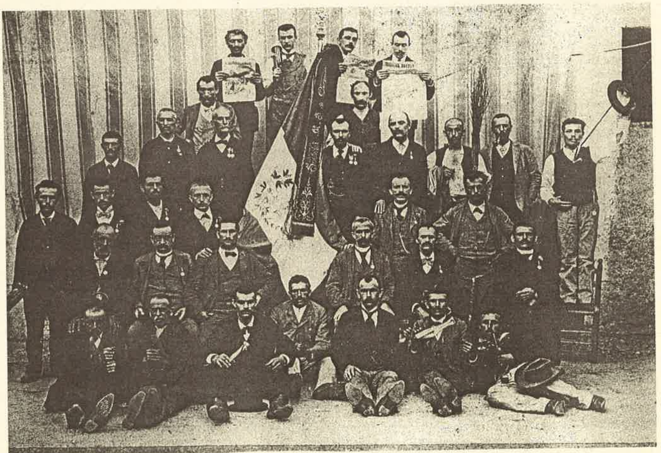
Foto di gruppo (d'epoca) per i soci della Società di Mutuo Soccorso Cooperativa di Corgeno

Possiamo chiudere ricordando alcuni spunti del discorso del Presidente che, agganciandosi al passato per sottolineare la determinazione e il coraggio dei soci fondatori e di tutti quelli che si sono succeduti nell'amministrazione, si è augurato per tutti un futuro che, pur tenendo conto dei tempi cambiati, non dimentichi mai l'ideale che ha dato origine e sorretto per tutti questi anni la nostra Società di Mutuo Soccorso. A tutti quelli che hanno lavorato per la preparazione di questa festa, un vivo ringraziamento.