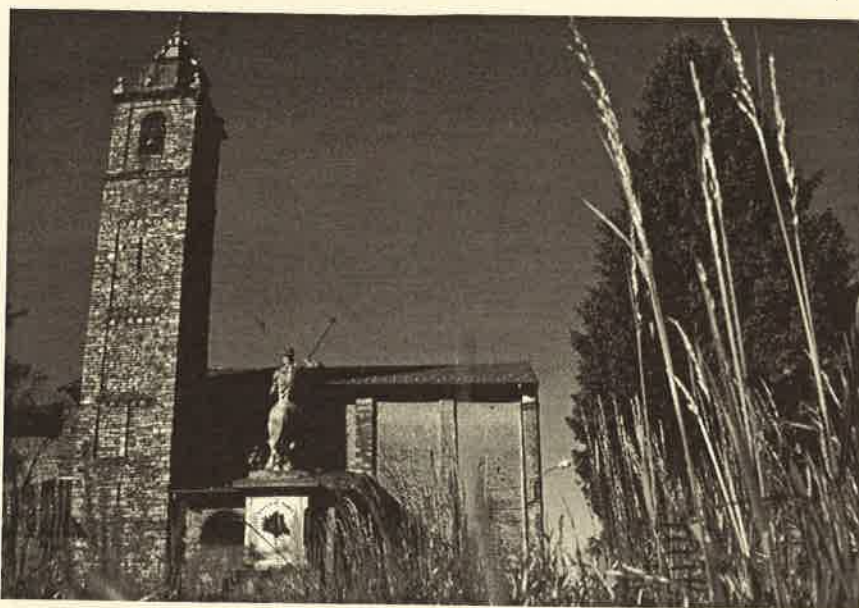
Il campanile di Corgeno

alzata, mi fece fare dietro front di corsa. Beh, da quella volta l'Etur, quando mi doveva stare vicino, aveva sempre con sé un rametto verde di salice. Ogni tanto me lo faceva sentire sulle orecchie e gambe e da allora imparai a stargli alla larga.