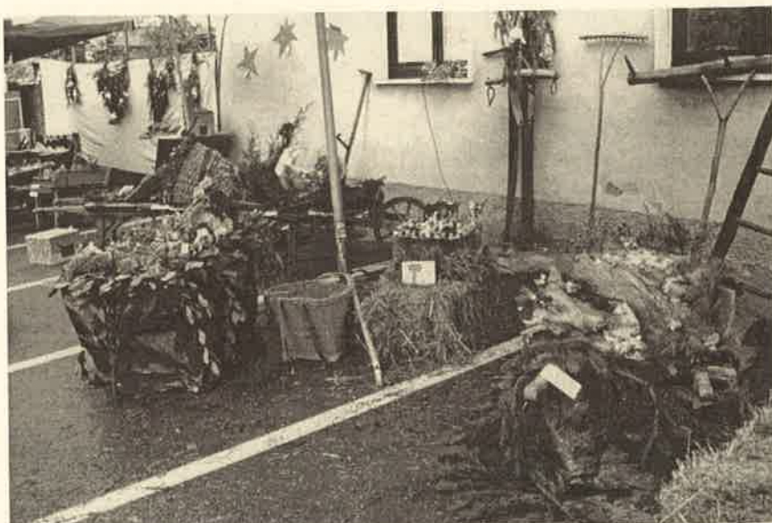
Un'immagine della rassegna "Presepi in carriola"

La votazione popolare ha decretato la palma del migliore ad una rappresentazione fatta con arachidi, noci e semi vari. A ruota si sono classificati due presepi con elaborati giochi d'acqua e di luci. A seguire: un presepe costruito in una damigiana, un altro fatto di polistirolo, un altro ancora messo in una vecchia "gerla" per il fieno, quindi presepe che metteva il bambinello sotto il campanile di Corgeno, perfettamente riprodotto. Altri presepi erano fatti con statuine provenienti da paesi lontani. Il più piccolo è stato fatto da un bambino che l'ha portato su una carriolina usata