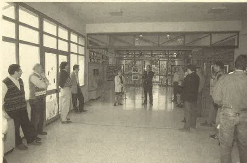
Concorso "Acqua è vita", un momento della premiazione

QUESTO GIORNALE È STAMPATO SU CARTA RICICLATA