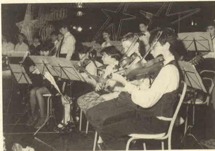
Alcuni allievi del gruppo strumentale "Vivaldi" durante l'esibizione dello scorso anno alla discoteca "Sinatra'm"

alle ore 19.00; giovedì 27, venerdì 28 e sabato 29 giugno dalle ore 15.00 alle ore 19.00; giovedì 4, venerdì 5 e sabato 6 luglio dalle ore 15.00 alle ore 19.00. Le iscrizioni si ricevono nella sede della scuola in via Fratelli Rosselli 26 a Corgeno di Vergiate (tel. 0331/946719).