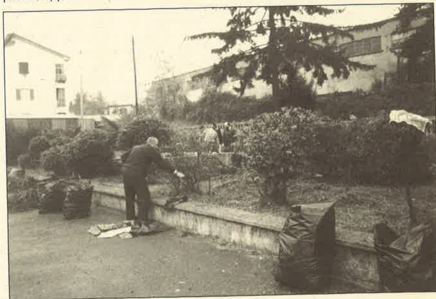
L'operazione "Stazione viva" è stata ripresa nel documentario di "Fuori campo"

verde, un po' meno per i rumori delle discoteche, per il traffico, per la discarica, tutte realtà che spesso ha contestato, e forse proprio per questo fatto conoscere anche a chi di arte non se ne intende.