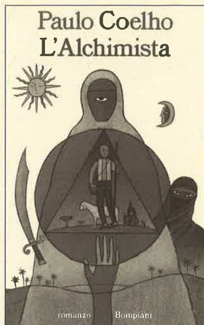
"L'Alchimista", di Paulo Coelho, Bompiani, p. 182, L. 26.000