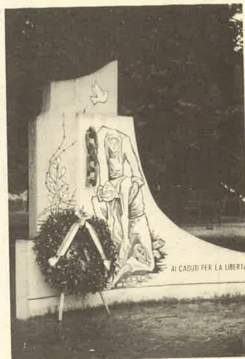
Commemorazione del 50° anniversario della Liberazione.