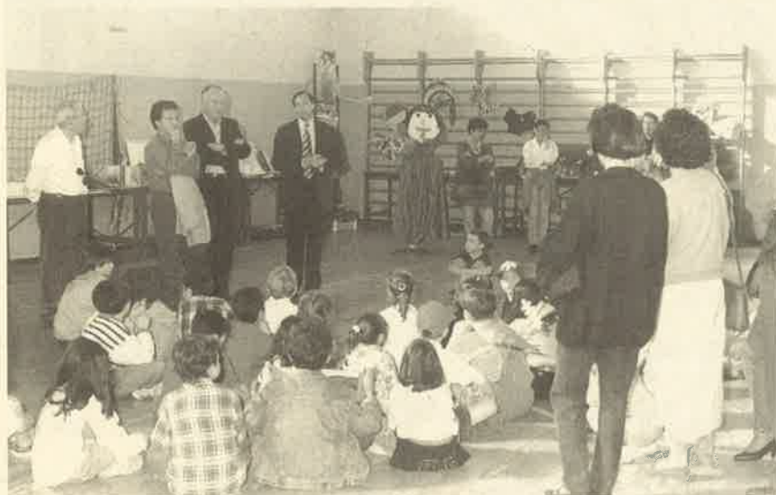
Il Maestro Enrico Baj ha premiato i bambini che hanno partecipato all'iniziativa con le loro creazioni