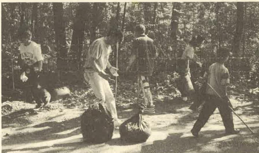
I volontari di Corgeno in azione durante la prima giornata ecologica