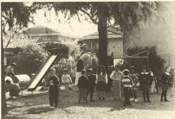
I ragazzini della Scuola materna di Cuirone