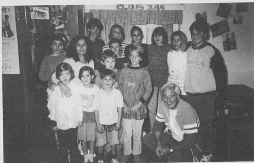
Foto di gruppo per i ragazzi di Vukovar

Corgeno è una frazione di Vergiate, che a sua volta è un Comune in provincia di Varese. E' qui che arriviamo dopo aver oltrepassato le frontiere e veniamo ospitati presso la scuola materna. Troviamo subito i ragazzi di Corgeno, con i quali fraternizziamo immediatamente, anche perché sono