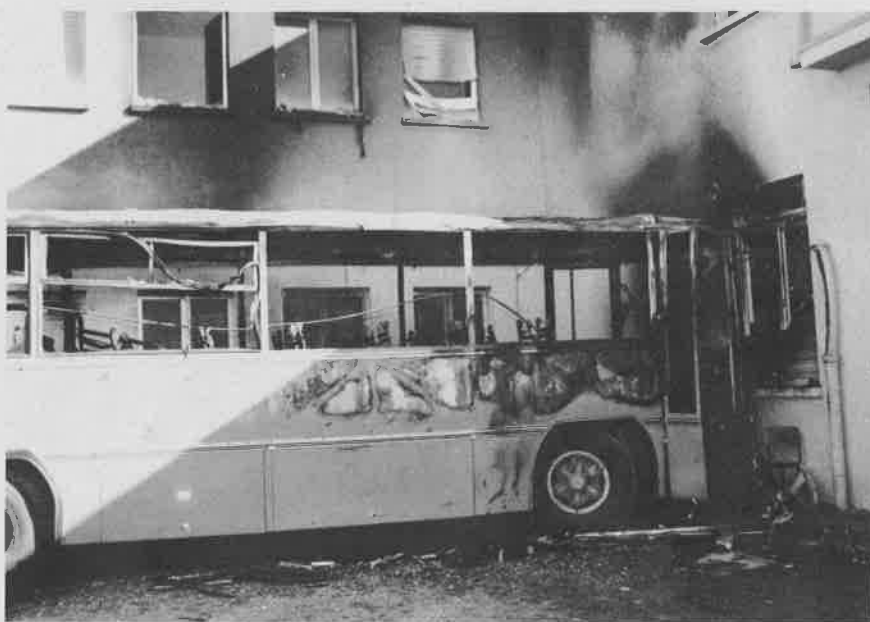
Lo Scuolabus distrutto da un incendio doloso

Questo autobus era stato acquistato dal Comune per la somma di 13 milioni e adesso, purtroppo, l'Amministrazione Comunale dovrà affrontare un costo di circa 300.000 lire da aggiungere alle attuali 270.000 del servizio gestito dalla ditta Giuliani e Laudi, quindi con una spesa giornaliera più che rad-