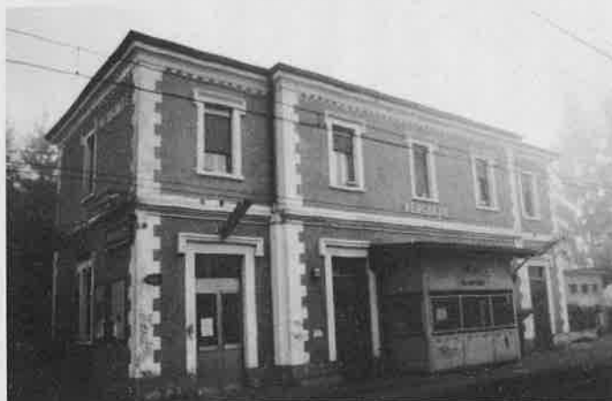
La stazione di Vergiate