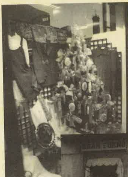
Nella foto le vetrine di Francesca Massironi abbigliamento (a sinistra), di Panetteria "Gran forno" (qui sotto) e, in basso, di Favaro arredamenti