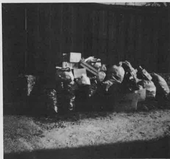
Due immagini di vicolo Nodèe alle prese con evidenti problemi di spazzatura