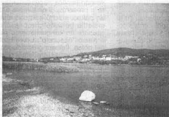
Il lago di Corgeno

CENNI DI STORIA E ATTUALITÀ DEL NOSTRO SPECCHIO D'ACQUA