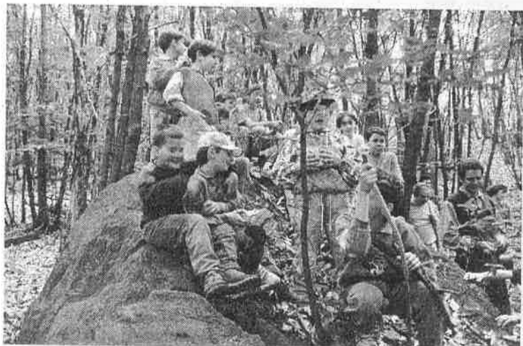
Ragazzi al parco comunale S. Giacomo