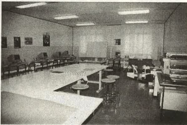
Un salone didattico del Centro di Formazione Professionale di Vergiate

frequenza obbligatoria presso la sede del Centro di Formazione Professionale Via A. Volta n. 9, Cimbro di Vergiate (edificio scuole elementari). È previsto un test di selezione per l'ammissione al corso. L'intervento formativo si concluderà con una verifica finale ed il rilascio dell'attestato di specializzazione da parte di apposita Commissione Regionale istituita ai sensi dell'art. 19 L.R. 95/80. Le domande dovranno essere presentate in carta libera, complete di dati anagrafici, titolo di studio, indirizzo, recapito telefonico e corredate dalla seguente documentazione: - certificato di nascita/residenza;