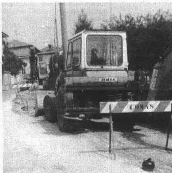
Negli ultimi anni per costruire depuratori e fognature (nella foto) il Comune ha speso circa 7 miliardi di lire

Di approvare lo stato finale dei lavori di sistemazione e potenziamento acquedotto comunale in Via Corgeno eseguiti dalla