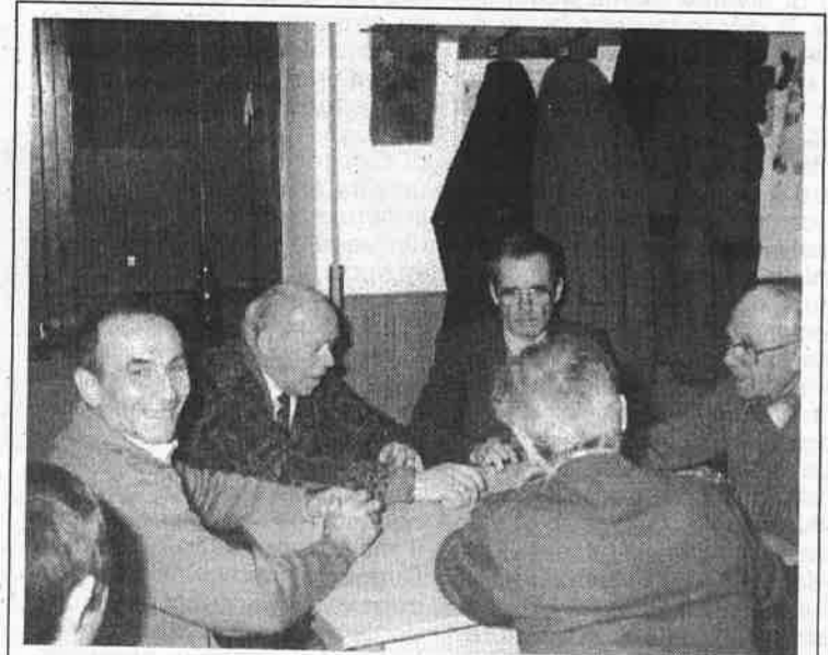
Pensionati intenti a giocare a briscola "chiamata" al Centro sociale comunale di Sesona

15) Non dimenticare mai che, quando il cuore è pesante, quando la forza viene meno e sei preoccupato e confuso, è un grande conforto avere vicino un amico sincero e comprensivo. Un amico così tu lo puoi trovare in A.A..