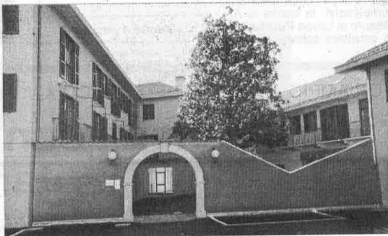
Una vista parziale del Centro socio-sanitario di Vergiate. In esso vi è collocata la farmacia, il distretto sanitario, alloggi per anziani, la biblioteca e l'Ufficio Servizi Sociali del Comune

tale sede. Inoltre tale tipo di tumore può più facilmente svilupparsi in portatori di certe malattie come la colite ulcerosa e la poliposi familiare. Se noi riusciamo a controllare periodicamente tale gruppo di persone, saremo in grado di fare una diagnosi precoce di un eventuale tumore sviluppatosi.