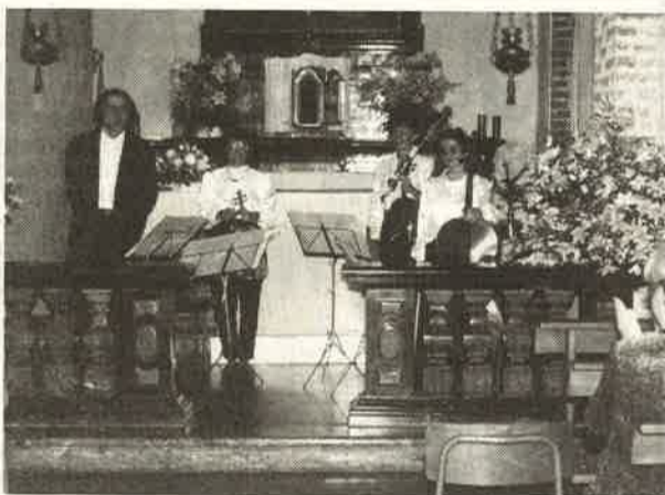
Quartetto Estense. Concerto di Domenica 13 settembre, Chiesa S. Maria