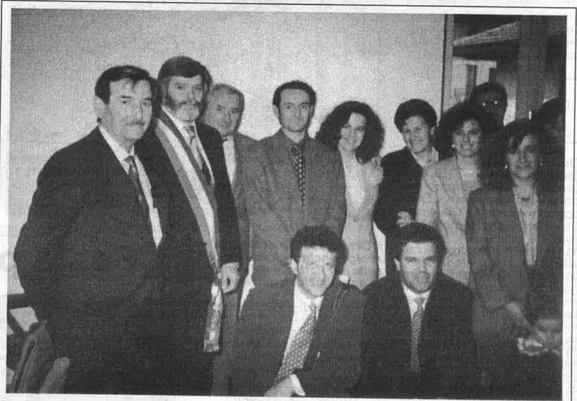
Foto di gruppo in Comune, con il Sindaco, dopo la celebrazione di un matrimonio con rito civile

Di fronte a questa situazione si lamenta un insufficiente intervento pubblico per cui in materia di conoscenza e di assistenza molto viene demandato al volontariato.