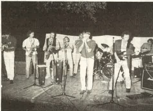
Concerto rock con i Satura Lanx, spiaggia Lago Corgeno