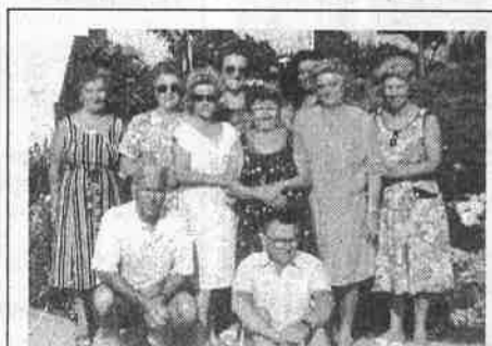
Alcuni degli anziani che hanno partecipato al soggiorno a Creta organizzato dal Comune

Se nel segreto della tua coscienza hai risposto "SI" quattro volte o più - e non è necessario che comunichi ad altri i risultati di questa autodiagnosi - è molto probabile che l'alcolismo ti minacci e che tu abbia bisogno di A.A. Se vuoi continuare a bere il problema è tuo e non ci riguarda; se vuoi smettere di bere, il problema diventa anche nostro!