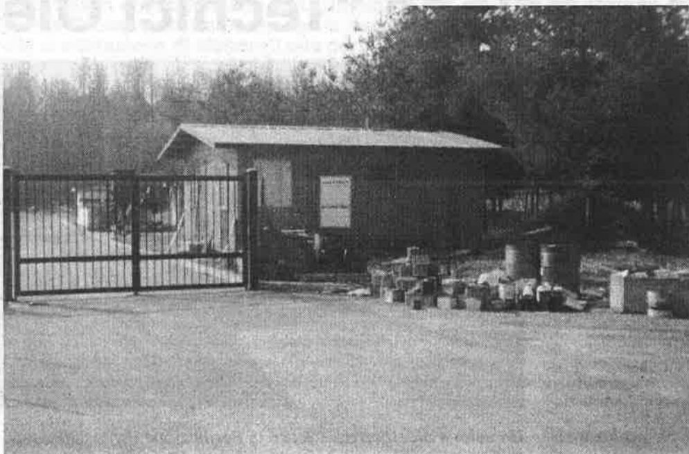
La casetta posta presso il centro di raccolta rifiuti differenziati di via S. Eurosia

Di concedere all'Impresa Costruzioni Edili Ceriani srl, con sede in Milano Via Giannone, 9, l'anticipazione contrattuale prevista ai sensi del citato D.M.