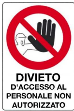
Divieto d'accesso al personale non autorizzato