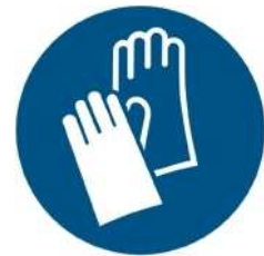
M009 - Indossare guanti protettivi