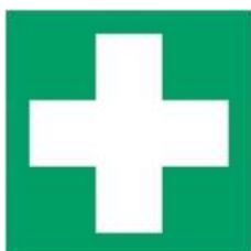
E003 - Pronto soccorso