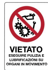
Vietato eseguire pulizia, riparazioni e lubrificazioni su organi in movimento