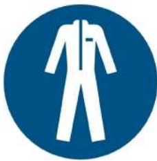
M010 - Indossare indumenti protettivi