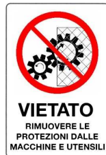
Vietato rimuovere le protezioni dalle macchine e utensili