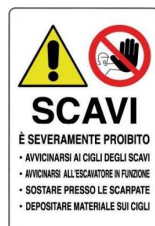
Divieto di accedere o sostare in prossimità di scavi