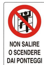
Vietato salire o scendere dai ponteggi senza l'utilizzo delle apposite scale