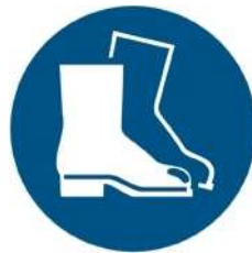
M008 - Indossare calzature di sicurezza