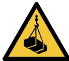
W015 - Carichi sospesi