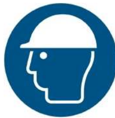
M014 - Indossare casco di protezione