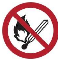
P003 - Vietato usare fiamme libere