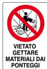
Vietato gettare materiali dai ponteggi