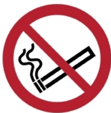
P002 - Vietato fumare