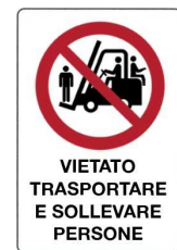
Vietato trasportare e sollevare persone