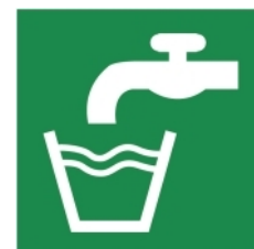
E015 - Acqua potabile