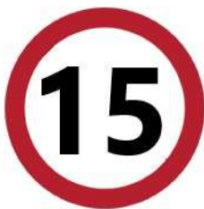
Velocità massima in cantiere di 15 km/h