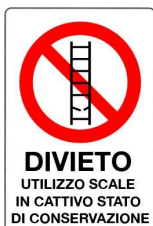
Divieto di utilizzo scale in cattivo stato di conservazione