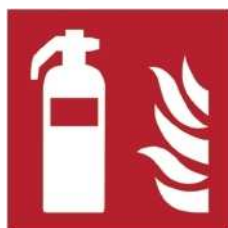
F001 - Estintore