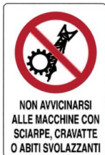
Vietato avvicinarsi alle macchine utensili con vestiti svolazzanti