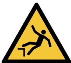
W008 - Caduta con dislivello