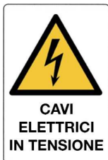
Cavi elettrici in tensione