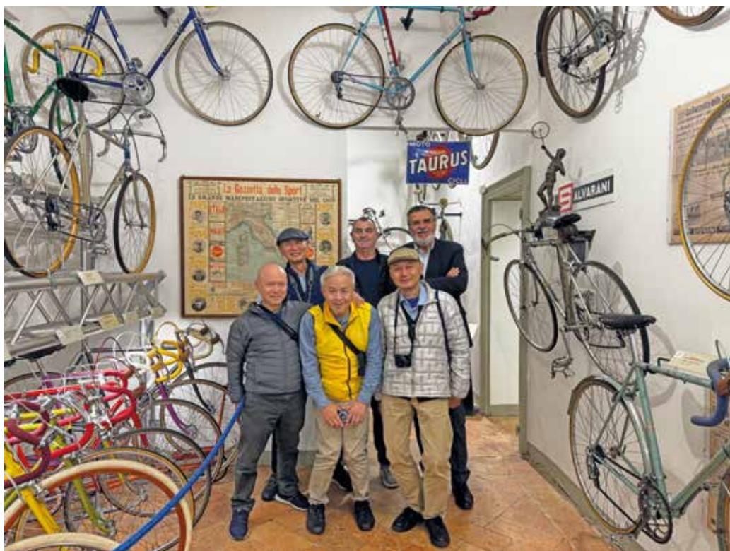
Nella foto alcuni giapponesi in visita al museo nel mese di settembre.