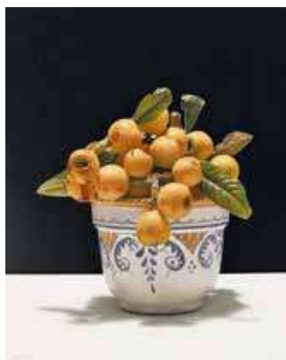
Il tempio del silenzio, 2009, olio su tecnica mista su tela, cm 60x50

Per fare un esempio, abbiamo analizzato l'Arte Analitica e i suoi maggiori esponenti - Riccardo Guarnieri ( Le Carte , 2019) ed Enzo Cacciola ( Struttura , 2024) - dimostrando che le sue