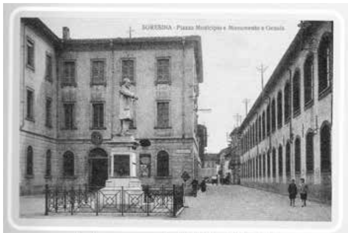
Soresina - monumento Genala in piazza del Municipio - di fronte si ergeva il grande edificio della filanda Guerin & Fils

con quindici lire al mese potessi vestirmi e pagare [l'affitto] della stanza alla Rossetti. Mi capirà Sig. Presidente che non ho più nessuno che pensi a me e l'anno scorso mi trovavo a servizio e ci sono stata tutto l'estate, ma d'inverno devo venir via, perché le Signore non mi tengono, perché con geloni non potrei adempiere al mio dovere e così mi sono raccomandata alle Suore di Monza [che] mi hanno preso nell'Istituto e intanto ho speso quel poco che avevo. Ora ho compiuto i 21 anni e cercavo qualche posto, ma non ne trovai con questa miseria che c'è e la mia Superiore mi ha condotto dalle Suore di Pontelambro ove ci sono tante ragazze che vanno allo stabilimento, ma io non potrei resistere e sono a casa ad aiutare la Suora in cucina; ora sono otto giorni che mi trovo in questo convitto di Pontelambro presso le Suore di Carità nel convitto operaio. La preghe-rei se potesse esitarmi quel po' di roba e poi mandarmi l'importo, altrimenti se mio fratello se ne impossessa io non posso pretendere più niente, come hanno fatto i miei cari parenti della roba dei miei genitori che avevo un po' di tela che adesso mi sarebbe utile e loro me l'hanno venduta. Sig. Presidente non so come fare, mi affido a Lei e le anticipo i miei ringraziamenti. E salutandola rispettosamente mi sottoscrivo la di Lei beneficata - Ines Mezzadri».