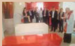
SALA DEL COMMiato