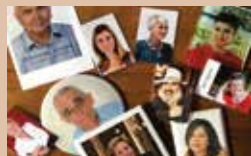
REALIZZAZIONE FOTOCERAMICHE E RICORDINI