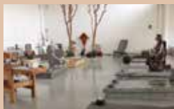
ESPOSIZIONE MONUMENTI AL COPERTO