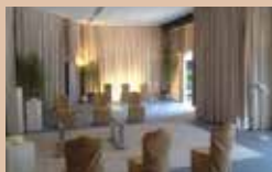
REALIZZAZIONE CAMERE ARDENTI