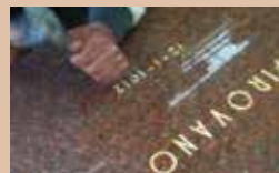
INCISIONI A MANO LIBERA