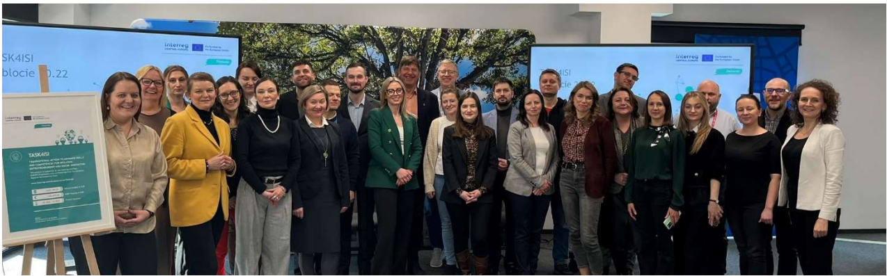
Il 2° incontro dell'ISIHUB a Cracovia: link to blog