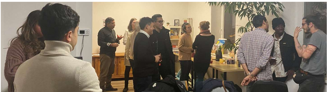
Riunione ISIHUB di febbraio in Germania