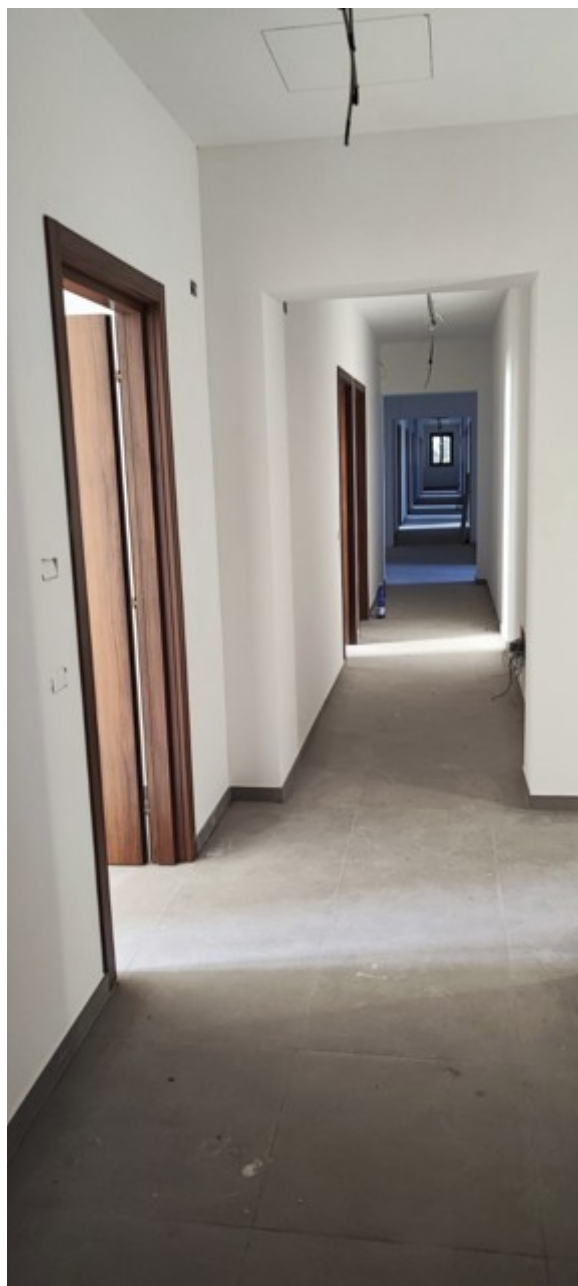
Interno Immobile Post-Operam