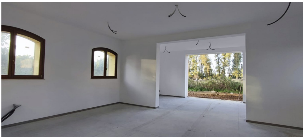
Interno Immobile Post-Operam