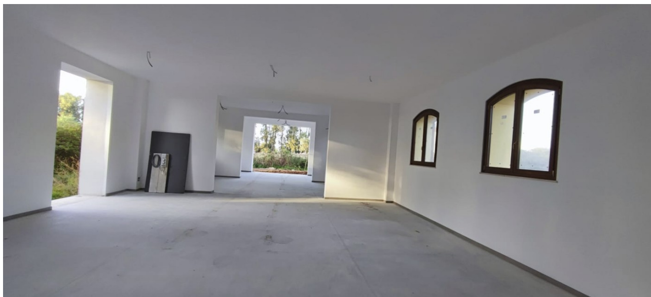
Interno Immobile Post-Operam