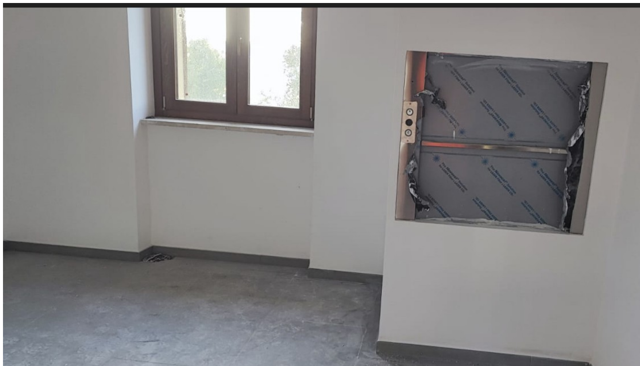
Interno Immobile Post-Operam