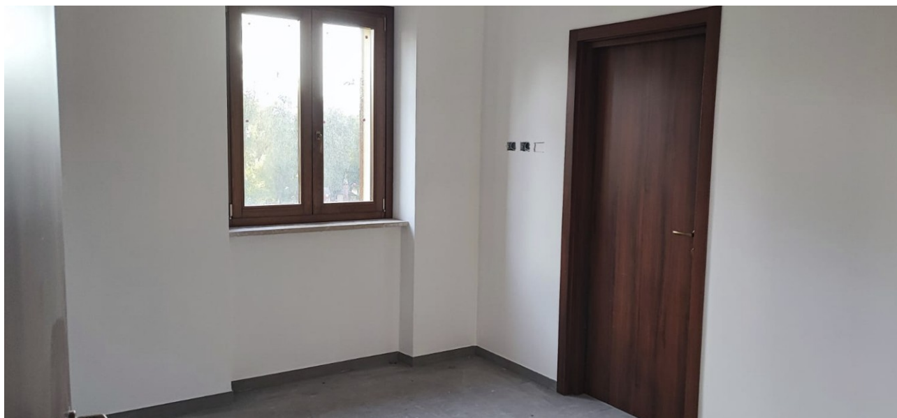
Interno Immobile Post-Operam