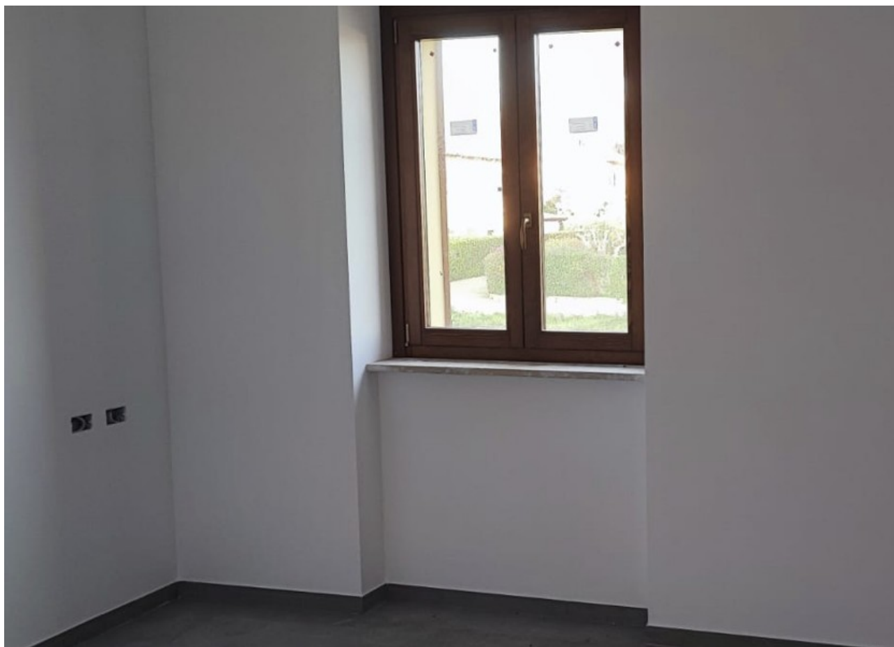
Interno Immobile Post-Operam