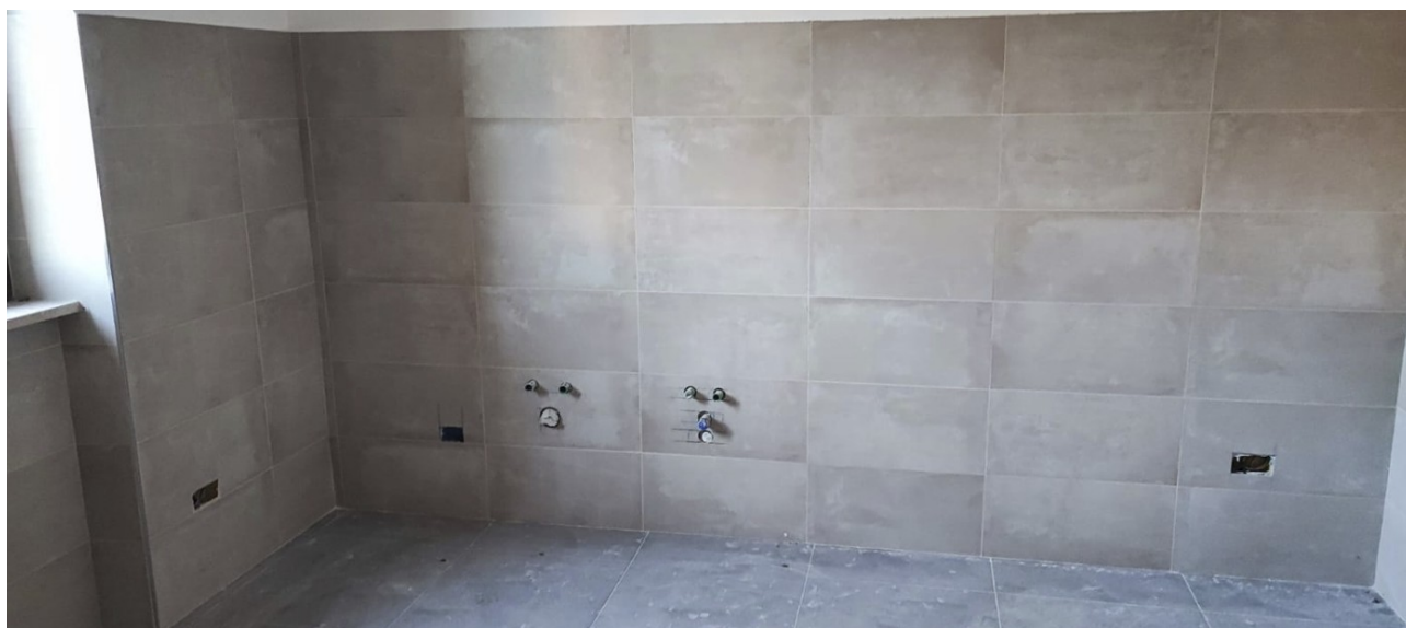
Interno Immobile Post-Operam