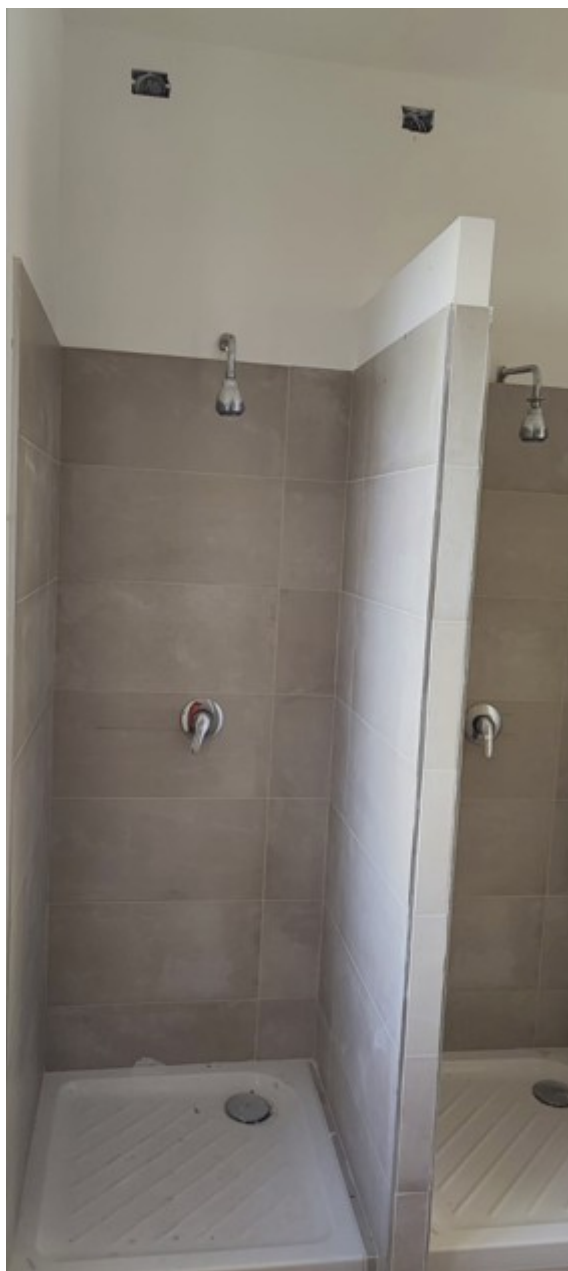
Interno Immobile Post-Operam