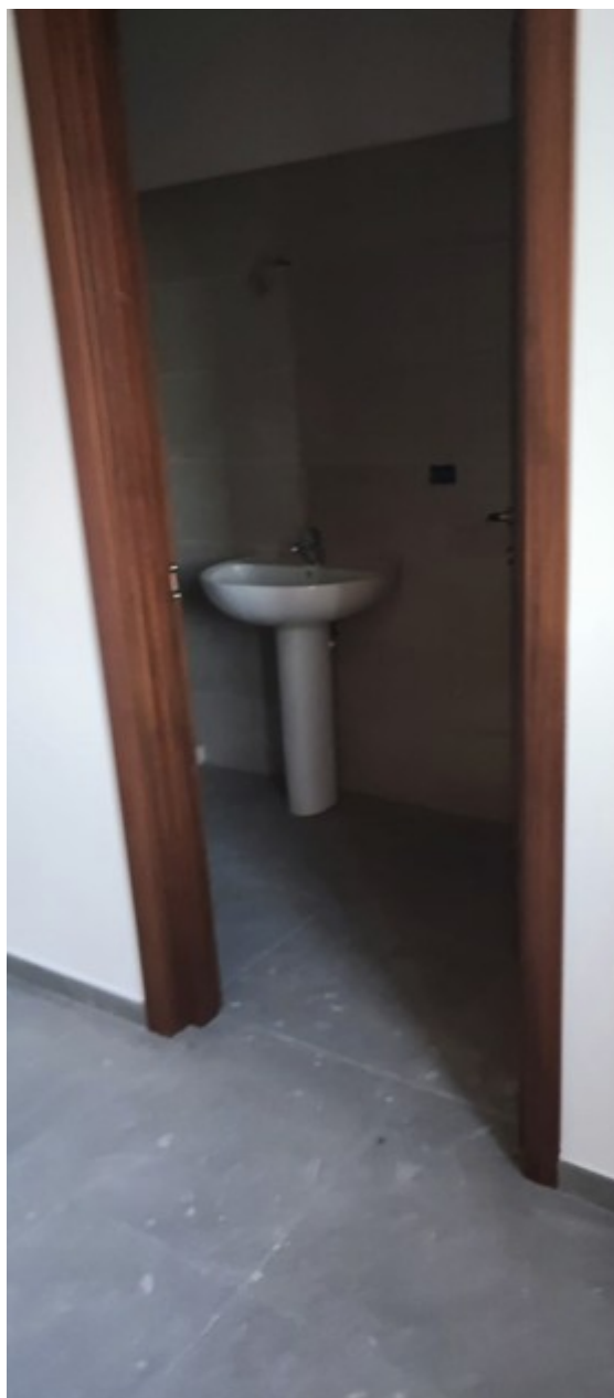
Interno Immobile Post-Operam