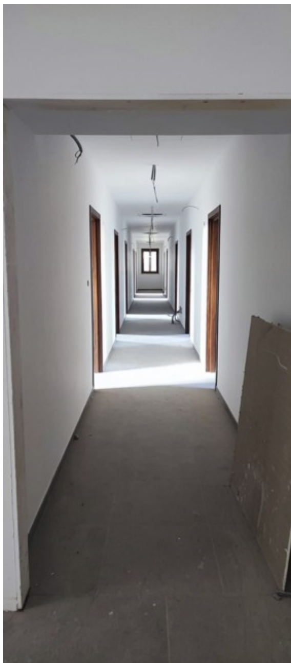
Interno Immobile Post-Operam