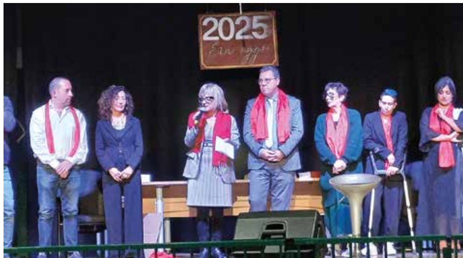
Un momento dello spettacolo "C'era e ci sarà una volta"

Certo, abbiamo giusto alle spalle il mese delle iniziative contro la violenza sulle donne. Nel solo novembre ne abbiamo proposte quattro: la presentazione del libro Laura Danzava e tre spettacoli teatrali, ossia C'era e ci sarà una volta , a cura del laboratorio teatrale Scarpette Rosse e Donne Insieme contro la violenza , due realtà locali che da sempre ci supportano sulle iniziative dedicate alle tematiche di genere; Finalmente sola , monologo messo in scena grazie a Humanitas University e rivolto agli allievi della scuola di cucina AFOL, e Il Volo della Farfalla , proposto dal Teatro dell'Ultim'ora. I nostri spazi culturali sono luoghi di confronto e sensibilizzazione, che utilizziamo per veicolare messaggi di parità e inclusione.