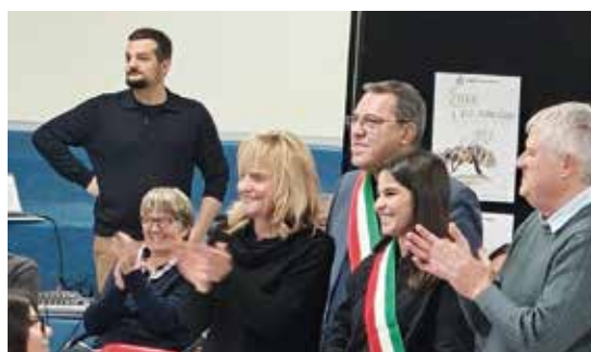
Un momento dell'ultimo Consiglio Comunale dei ragazzi e delle Ragazze

Partirei dal Consiglio Comunale delle Ragazze e dei Ragazzi (CCRR) , percorso di riflessione e partecipazione democratica per giovani dai 9 ai 14 anni. Gli studenti stanno lavorando sulla cura dell'ambiente attraverso la creazione di una campagna pubblicitaria; inoltre si sono confrontati con diverse associazioni locali sul tema del volontariato. Sempre riguardo all'educazione civica, proponiamo per gli studenti delle classi V delle primarie il percorso Noi e la