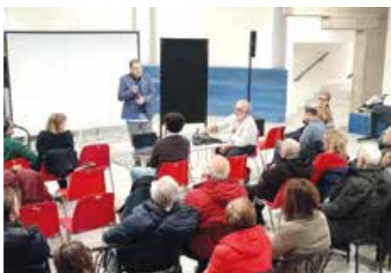
La presentazione del Bilancio di previsione al Centro civico Castelli