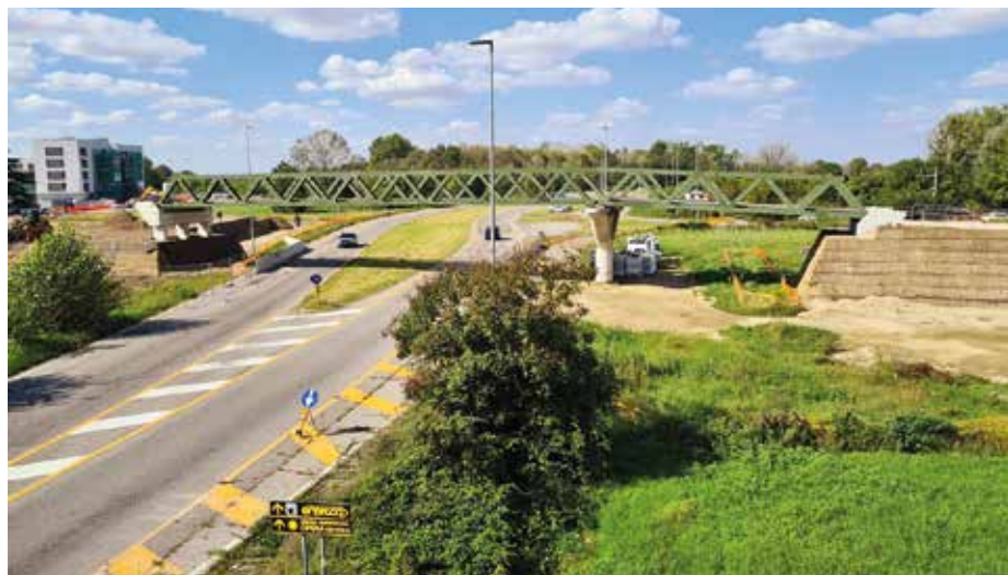
Il nuovo ponte ciclopedonale che collega via delle Rose e via dei Pini

Un passo decisivo è stato l'approvazione del Piano Attuativo per l'Area Ex Panther, dove sorgeranno nuove medie strutture di vendita, la nuova sede della Farmacia Comunale, aree verdi e circa 300 parcheggi pubblici. Contestualmente è previsto il recupero dell'Ex Hotel Ripamonti 2 e la riorganizzazione degli spazi circostanti. Questi interventi, insieme alle opere su viabilità, sostenibilità e mobilità dolce, delineano una città più moderna e accessibile, capace di coniugare crescita economica, coesione sociale e qualità della vita.