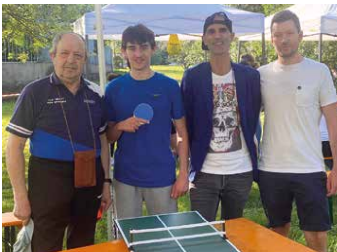
La Festa dello sport: un momento di visibilità per le Associazioni e di aggregazione per i giovani