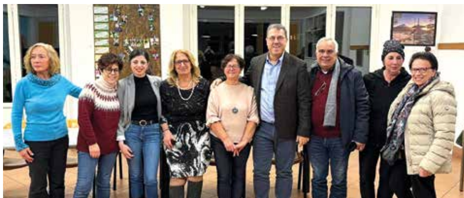
Le celebrazioni per la giornata internazionale per le persone con disabilità

Abbiamo rinnovato l'impegno con la creazione della nuova Consulta Disabili come strumento chiave di inclusione. Sul fronte della sensibi-