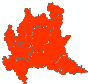
DOMANI SABATO 27/06