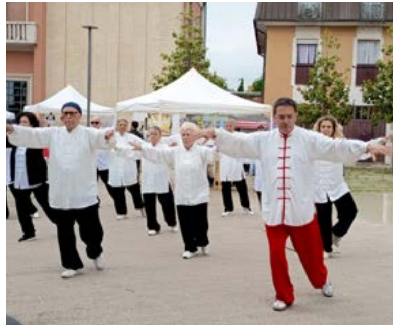
Esibizione dimostrativa dell'associazione Mani Come Nuvole del Tai Chi