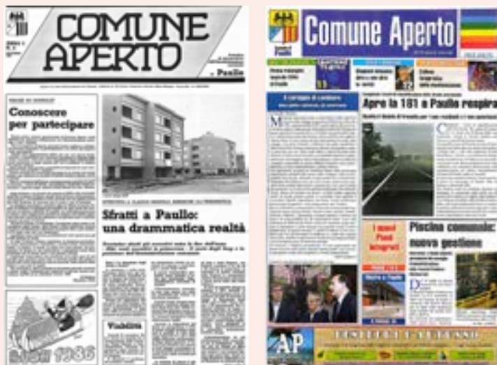
L'edizione numero 0 e la prima a colori di Comune Aperto.

Quest'anno Comune Aperto compie 40 anni. Nasce nel lontano 1986, prima in bianco e nero, poi, dal 2004, a colori.