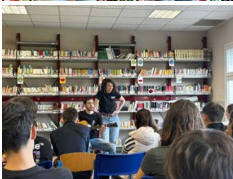
Alcuni momenti della lezione-spettacolo "Vieni con me".

gnificativo di questo percorso. L'attenzione e la partecipazione dimostrate dagli studenti hanno restituito un messaggio