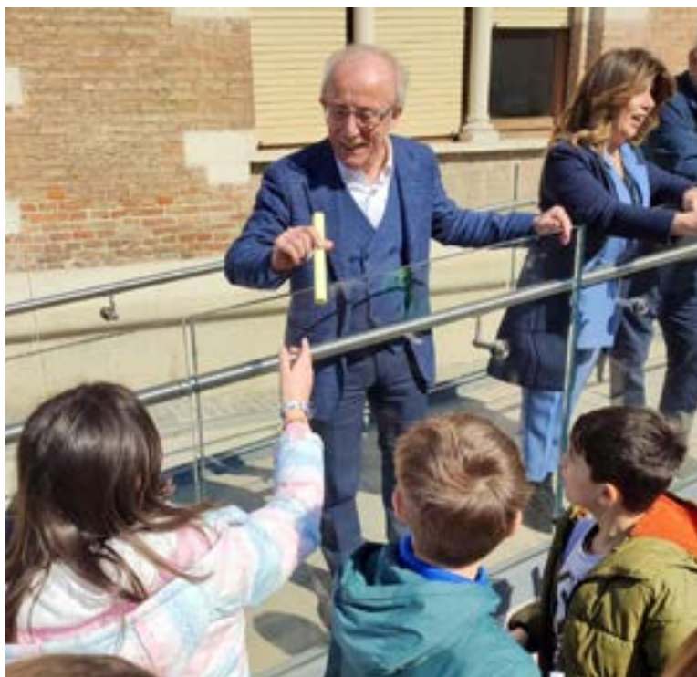
Il Sindaco riceve in dono i componimenti realizzati dai bambini

La 5 a A ha dato vita a una poesia collettiva dedicata al buio: «Il buio è nero e quello che nasconde è un mistero - hanno recitato i bambini -. Quando mi sto per addormentare i sogni iniziano ad arrivare. Possono essere diversi e al risveglio me