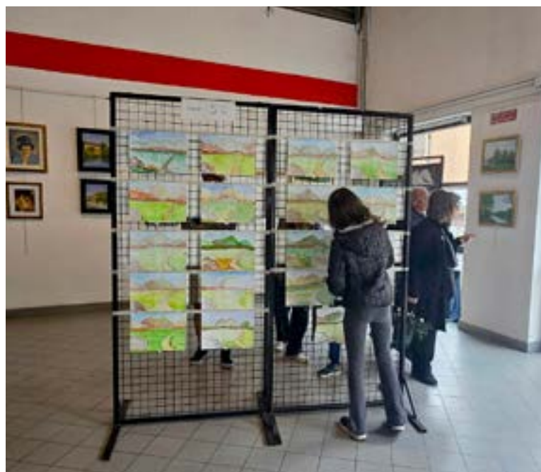
Il Circolo Van Gogh mette in mostra le opere degli alunni delle elementari.

Nello spazio Coop il Circolo Van Gogh ha esposto le sue opere e disegni realizzati dagli alunni delle scuole elementari, regalando colore alla fiera. Per il mondo animalista erano presenti Asso di Cani e Gatti, Oasi Felina Miao Miao e I Cavalli delle Fate ASD, impegnate nella sensibilizzazione verso il benessere degli animali. Apprezzate anche le dimostrazioni sportive: la pallavolo è stata rappresentata dalla ASD Smile Paullo, la ASD Mani Come Nuvole ha regalato momenti di calma e armonia con il Tai Chi, mentre il Basket Team Paullo 2.0 ASD ha coinvolto bambini e ragazzi tra tiri a canestro e giochi sportivi.