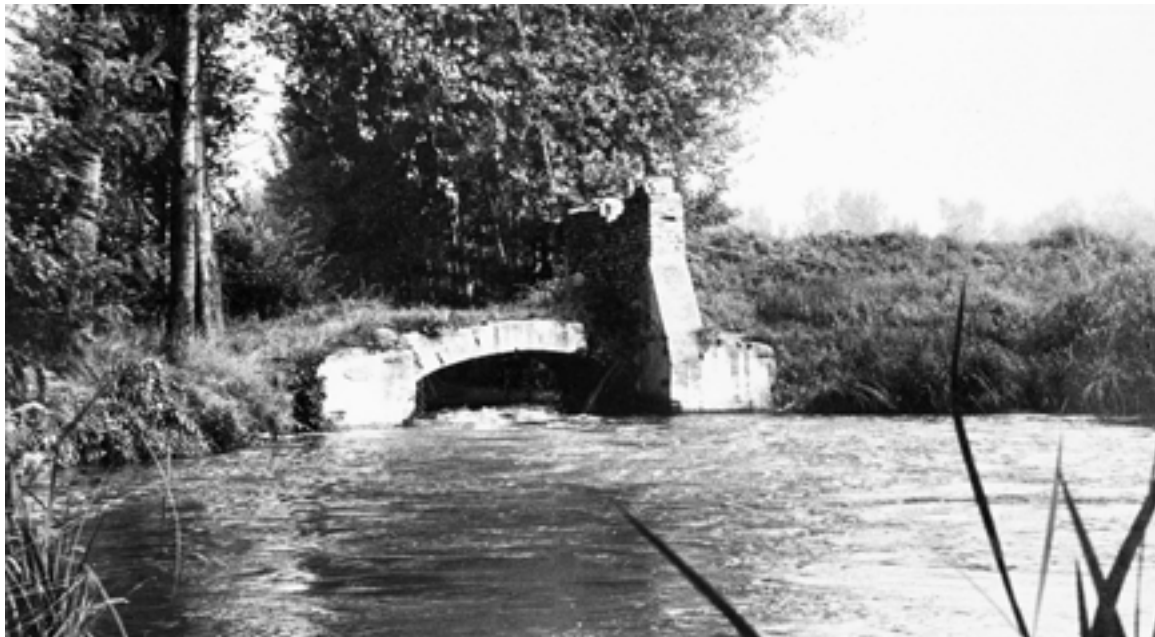
Ponte sulla Codogna (oggi scomparso) chiamato "pùnt de san Pedrin"

Continua la serie sulle chiese scomparse che sono sorte, durante i secoli, nel circondario. Stavolta l'approfondimento riguarda la chiesa di San Pietro in Campo