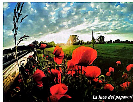
La luce dei papaveri