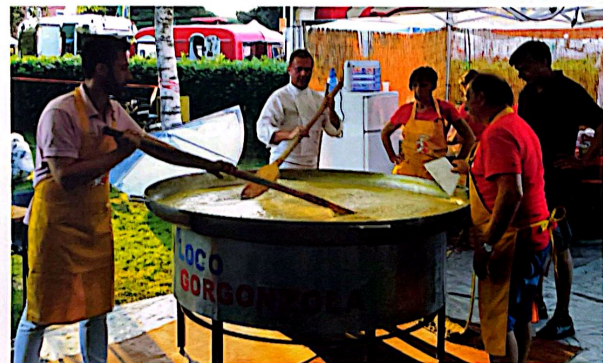
AI FORNELLI | volontari della Pro Loco con lo Chef Daniele Persegani (al centro)

"Buona la prima". Di solito queste parole vengono utilizzate nell'ambito del cinema, ma in questo caso calzano a pennello. "El dì de la festa - La sagra che non c'era", organizzata dalla Pro Loco e dall'Amministrazione comunale si è rivelata un grande successo e ha coinvolto tantissimi cittadini che, nelle giornate di sabato 16 e domenica