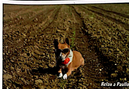
Relax a Paullo