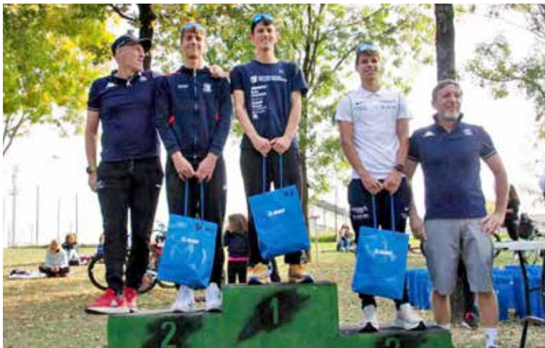
A sinistra, alcuni momenti della gara. Sopra, le premiazioni degli atleti