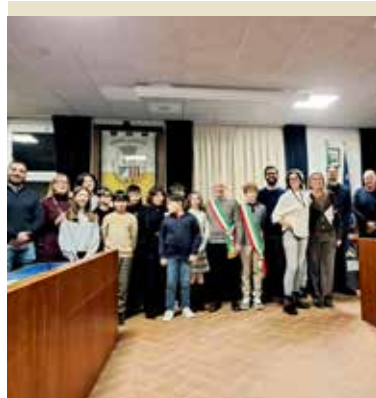
Gli Amministratori Comunali, piccoli e grandi, in Sala Consiliare