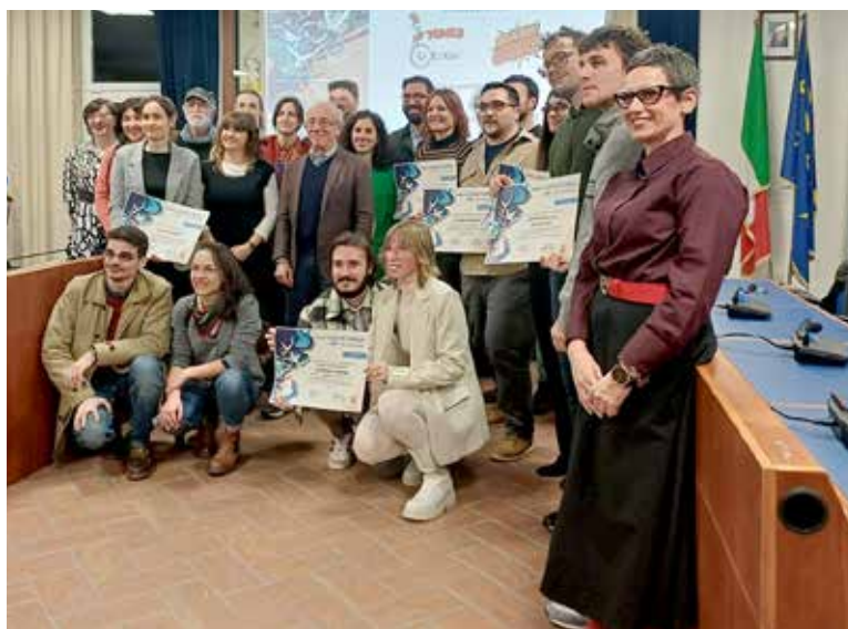
Tutti i vincitori del Premio Illustratori Tarantasio