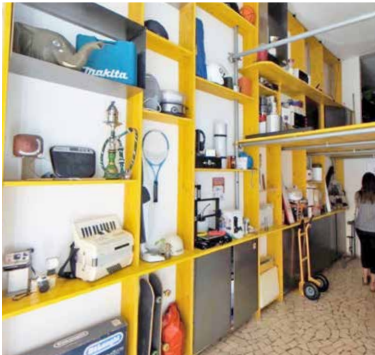
Il progetto troverà dimora all'interno del nuovo polo culturale. La realtà locale sarà uno dei tre hub principali della rete bibliotecaria CUBI. Nella foto, la Biblioteca degli Oggetti "Leila" a Bologna

Un nuovo modo di concepire e vivere la "casa dei libri": negli scaffali non ci saranno più solamente volumi, ma anche attrezzi da lavoro, piccoli elettrodomestici, articoli per il tempo libero e molto altro. Si tratta della "Biblioteca degli Oggetti", un progetto innovativo che sorgerà all'interno del nuovo polo culturale e che farà della Città di Paulo uno dei tre hub principali della rete bibliotecaria CUBI, insieme a Pioltello e Vimercate.