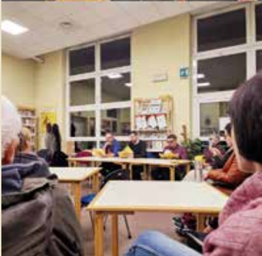
Alla presentazione del volume