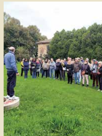
Durante una visita