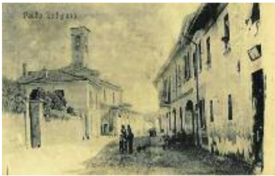
Una cartolina di Paullo del 1908

La nostra epoca, pur con tanti lati negativi, presenta tuttavia un aspetto molto positivo riguardo al passato: la documentazione, quanto più possibile, della realtà quotidiana attraverso la fotografia. È stata questa indubbiamente un'invenzione rivoluzionaria, almeno quanto quella della stampa, un'invenzione relativamente recente, in quanto risale ai primi dell'Ottocento (esattamente al 1816). Prima di allora, per documentarsi sulla realtà circostante bisognava osservare attentamente le immagini offerte dall'arte figurativa, le fonti documentarie, persino la narrativa e la poesia, la trattatistica, con tutte le deformazioni e approssimazioni imputabili sia all'individualità dell'artista o dello scrittore, sia al suo livello di preparazione nonché alla ideologia retrostante. Quante sensazioni, quante suggestioni, quanti sentimenti e soprattutto informazioni si racchiudono in una fotografia!