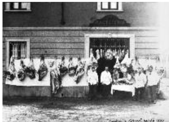
Macelleria Grisoni in una foto del Natale del 1920

dei clienti. Tanti piccoli particolari che valgono come testimonianza almeno quanto uno studio di storia locale.