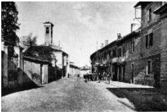
Una foto di Paullo dei primi anni Venti-Trenta

Ecco, ad esempio, una strada del nostro paese, via Milano o la Vecchia Paullese, ripresa in due epoche diverse. La prima risale addirittura al 1908. Vi si vede di scorcio l'antica chiesa parrocchiale con tutto il suo fascino, le abitazioni tuttora esistenti, alcune con i muri intaccati dall'umidità, due uomini, un bambino e un cane in mezzo alla via ancora in terra battuta, un gruppetto di bambini in posa sulla destra, e alla finestra, quasi in primo piano, una giovane donna con un'elegante acconciatura da libro Cuore che non nasconde la sua curiosità.