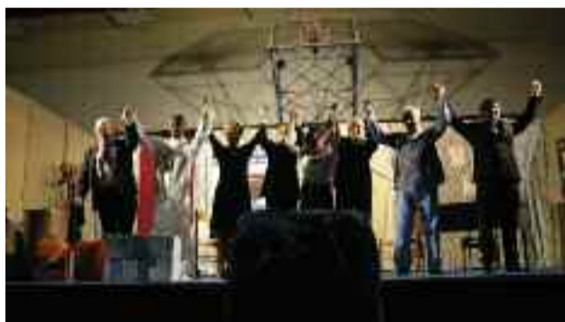
19 dicembre - Le compagnie teatrali: "I Tiratardi" e "Frontiera"