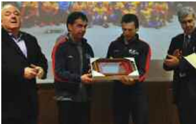
Premio a ASD Pedale Paullese per gli importanti traguardi agonistici raggiunti