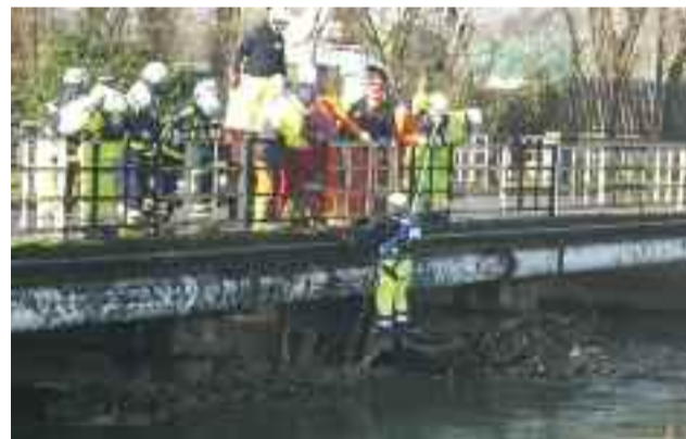
Rimozione alberi canale Muzza, 2010

Sebbene l'opera di volontariato sia assolutamente gratuita, la legge italiana ha provveduto a tutelare i volontari-lavoratori: in caso di particolari impieghi nelle emergenze di Protezione Civile essi vengono comunque retribuiti. È lo Stato stesso che provvede a rimborsare il datore di lavoro, sia esso pubblico che privato.