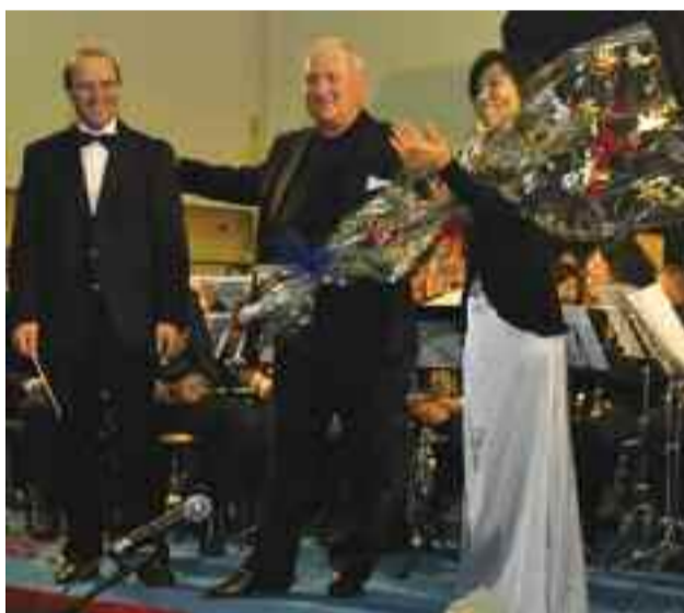
17 dicembre - Il Concerto della Banda Santa Cecilia

Le immagini più significative della rassegna di spettacoli più cara ai paullesi