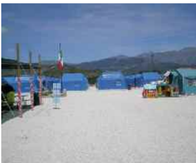
Campo Monticchio 2, Abruzzo, 2009

quello di creare in ogni territorio un servizio di pronta risposta alle esigenze riscontrate. In particolare ogni associazione deve essere in grado di cooperare, integrandosi con le altre figure professionali presenti in caso di intervento: Vigili del Fuoco, forze dell'ordine e di primo soccorso, valorizzando al massimo le forze della cittadinanza attiva ed organizzata presente in ogni comune d'Italia. Molte e varie figure professionali sono presenti all'interno delle organizzazioni di volontariato, ognuna delle quali risulta fondamentale durante le grandi emergenze, quando la buona riuscita di un intervento dipende anche dalle competenze di ciascun volontario.