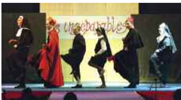
5 gennaio - Il Gruppo Inseparabili della Croce Bianca