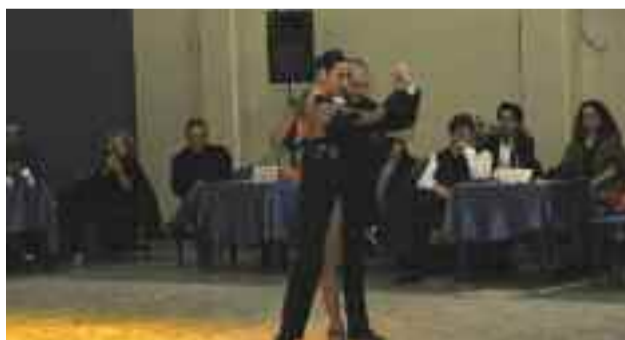
22 dicembre - Una noche de tango