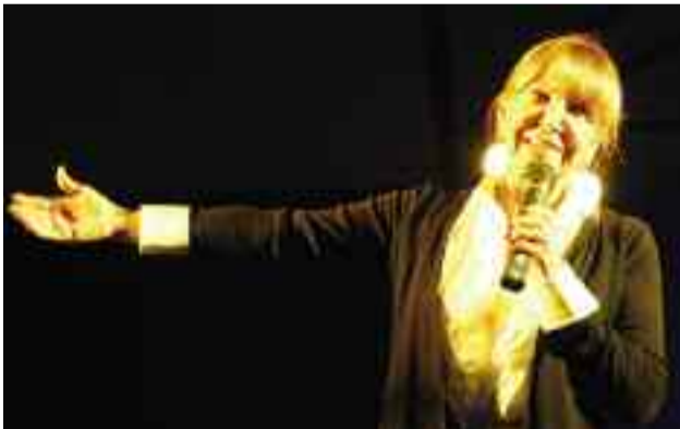
6 gennaio - Concerto revival con Wilma Goich