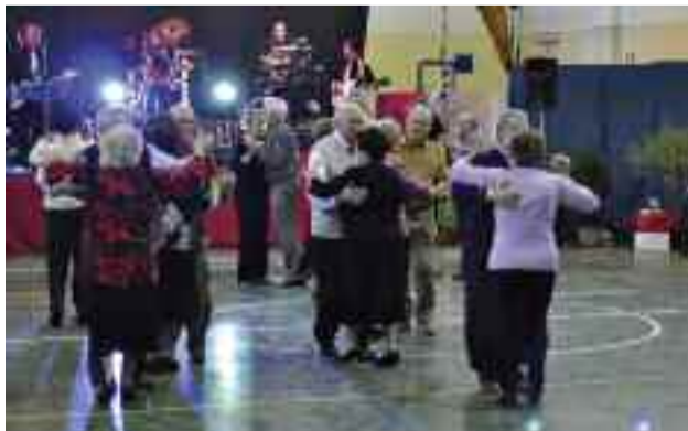
6 gennaio - Festa della Terza Età