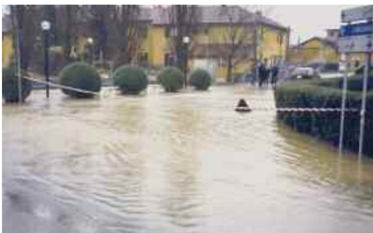
Esondazione del canale Addetta in località Tribiano