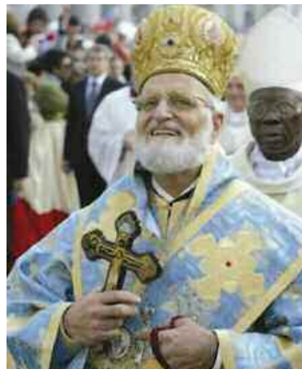
Gregorios III Patriarca della Chiesa Cattolica d'Oriente