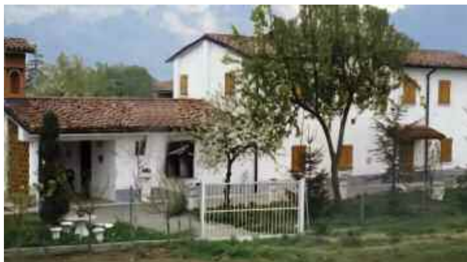
Eremo Monsignor Attilio

L'onorificenza data ai nostri concittadini costituisce il giusto riconoscimento al loro spirito di solidarietà e di altruismo che si è espresso sia a Paulo che nei luoghi in cui opera la Chiesa d'Oriente.