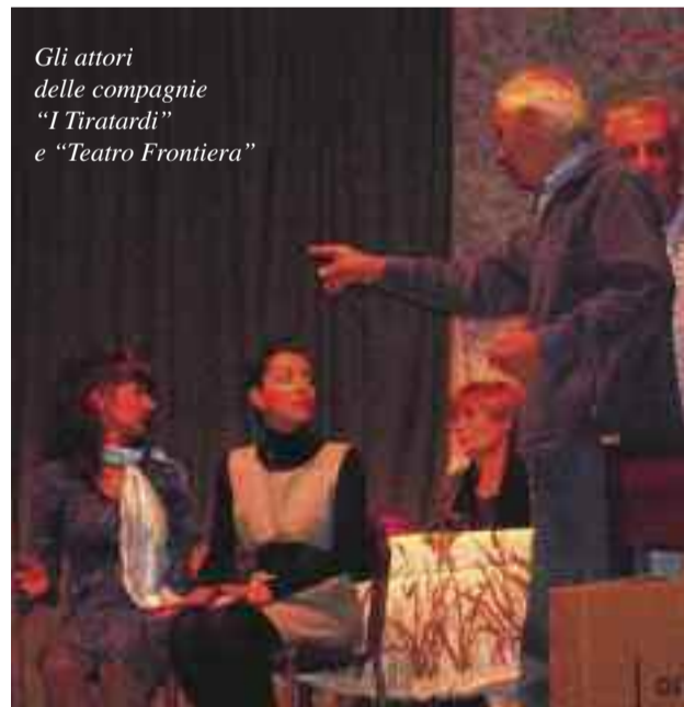
Gli attori delle compagnie "I Tiratardi" e "Teatro Frontiera"