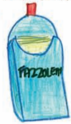
Disegno di Elide De Vecchi

QUANDO SI STARNUTISCE BISOGNA COPRIRE LA BOCCA CON UN FAZZOLETTO DI CARTA PER POI BUTTARLO NEL CESTINO