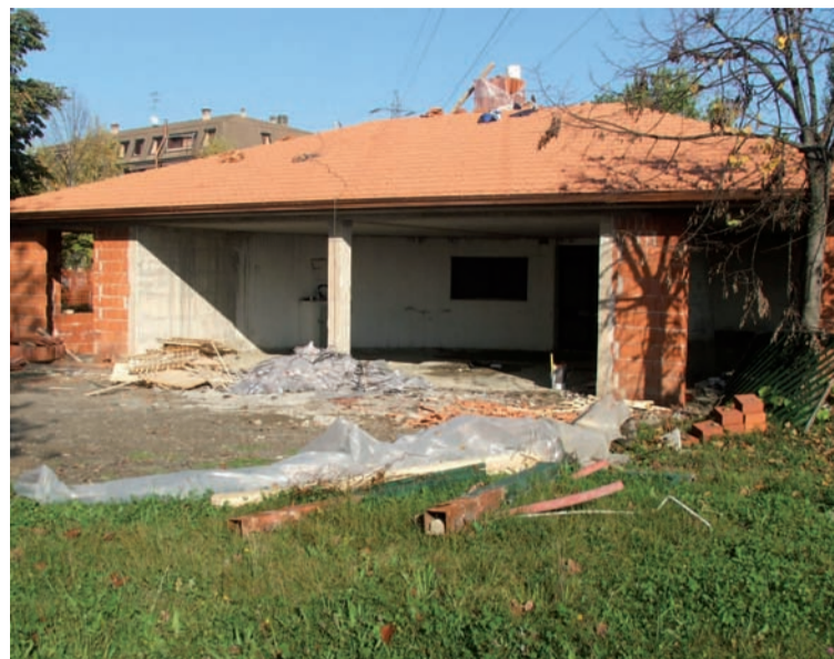
La nuova sede della Protezione Civile in costruzione

coperture, pavimentazione del viale principale).