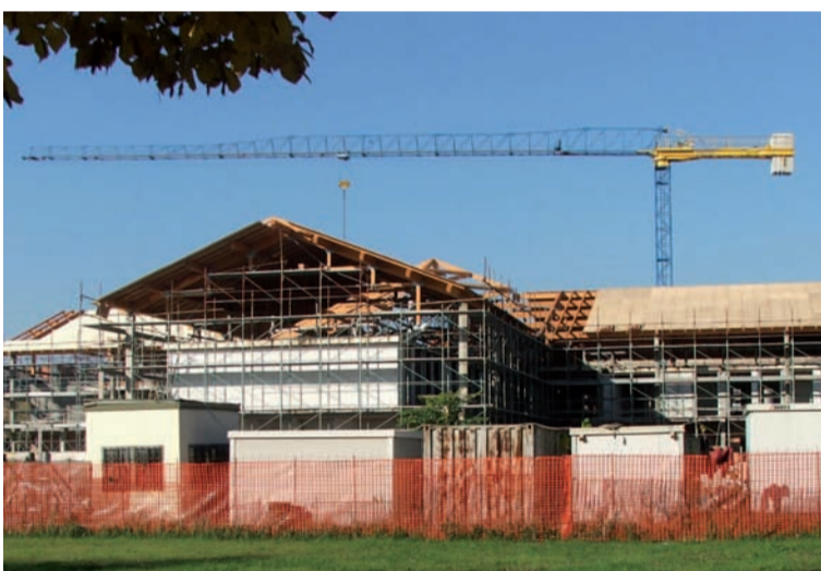
Il Centro Socioresidenziale per anziani

• In via sperimentale è stata realizzata un'area riservata ai cani e fornita anche di panchine. Situata in via Sacco e Vanzetti, l'area è periodicamente igienizzata. A fine sperimentazione si verificherà se riproporre in altre zone questa soluzione.