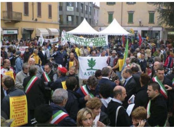
Melzo, 24 ottobre 2004. La manifestazione contro Bre.Be.Mi. e Tangenziale Est Est