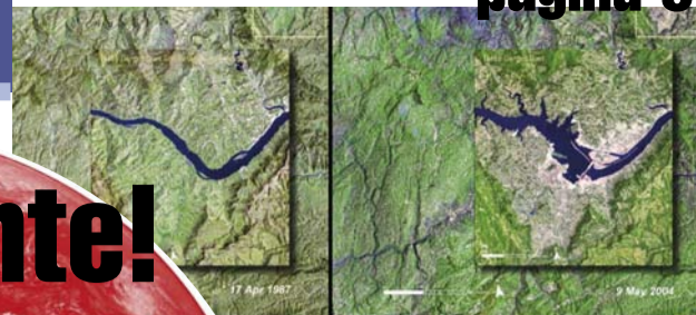
Cina, la diga delle Tre gole L'impatto ambientale sul fiume Yangtze

decisione a livello globale che preveda riduzioni di Co2 ben più cospicue di quelle stabilite dal Protocollo di Kyoto.