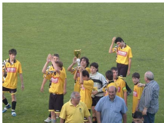
Categoria Giovanissimi, premiazione del 21° Torneo di Paullo