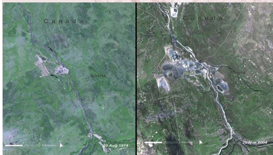
Canada, Alberta. Gli effetti dell'estrazione del petrolio dalle sabbie bituminose nella regione