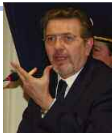
Il presidente Filippo Penati

Per realizzare questi progetti è necessario programmare, senza perdere ulteriore tempo, il reperimento e lo stanziamento di risorse adeguate: il pubblico farà la