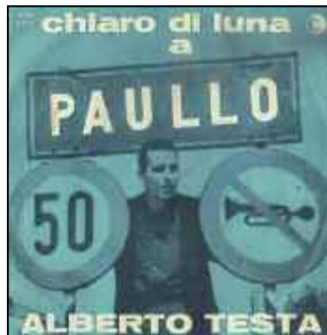
Copertina originale del 45 giri: "Chiaro di luna a Paullo" del musicista Alberto Testa

Ad accomunare Paullo a Maubeuge era sicuramente il clima non proprio splendido: il tipico grigiore nebbioso invernale ed il pallido sole, intorpidito anche d'estate. Inoltre il cantautore Testa aveva trovato un'altra forte similitudine tra i due piccoli centri di periferia: la dislocazione geografica. Così come Maubeuge infatti Paullo si trova in mezzo al corso di due fiumi e quindi in un paesaggio in cui, anche d'estate, la luna rischiara faticosamente la foschia e risplende sui campi che circondano ancora il territorio. Proprio come la luna citata dalla canzone, anche il dolce