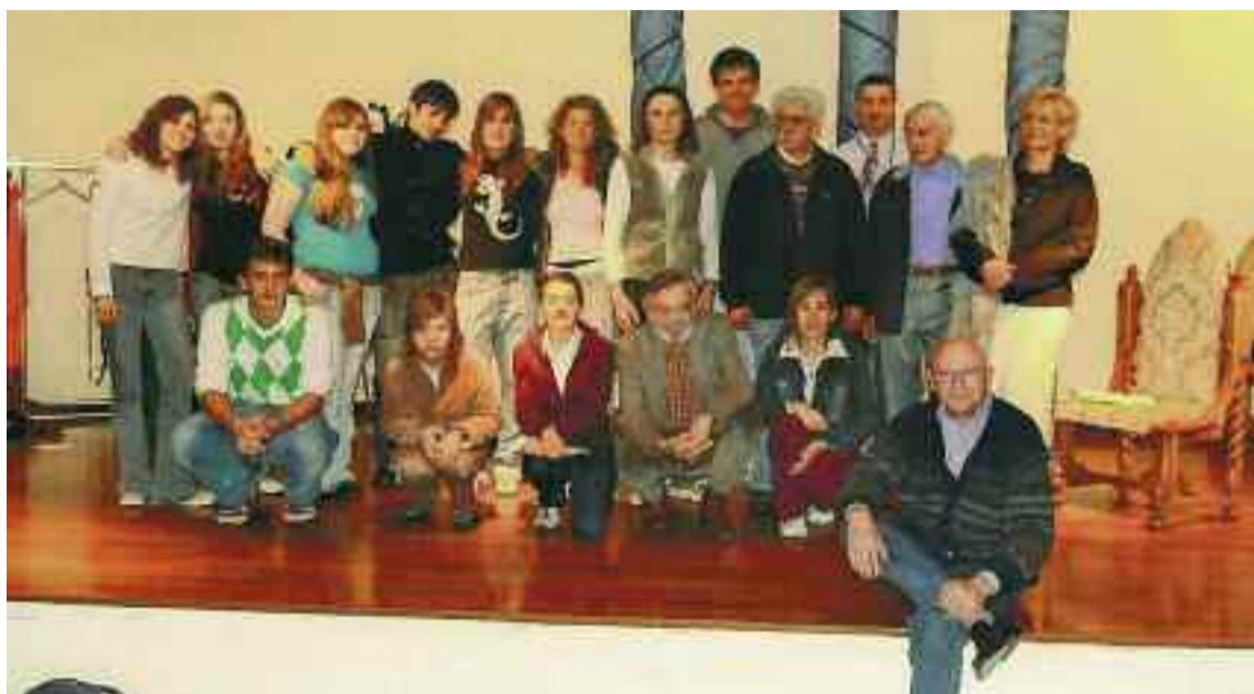
La compagnia teatrale "Frontiera"

Grande successo dell'opera teatrale di Franco Celenza