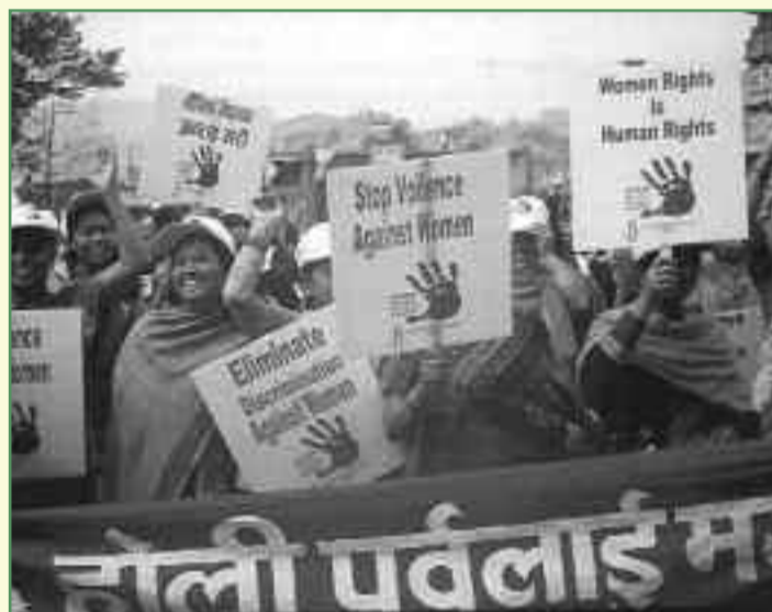
Nepal. Manifestazione di Amnesty International contro la violenza sulle donne

Associazione dei Club Alcolisti in Trattamento