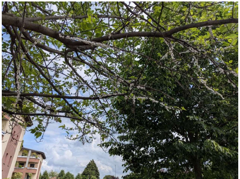
Figura 2: esemplari di Morus sp. con un grado di infestazione da Takahashia japonica tale da rendere inefficaci eventuali interventi di potatura (Foto di: Laboratorio del Servizio Fitosanitario della Regione Lombardia).