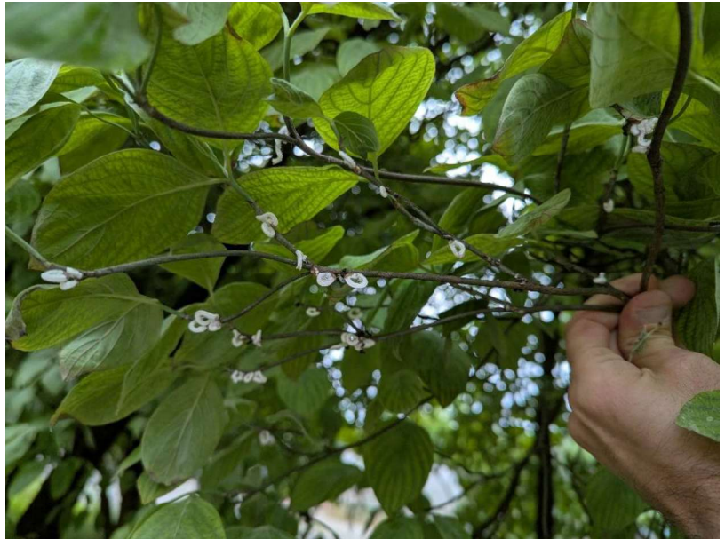
Figura 1: esemplare di Cornus florida con pochi rami infestati da Takahashia japonica per il quale un eventuale intervento di potatura nelle prime fasi dell'infestazione potrebbe risultare efficace.