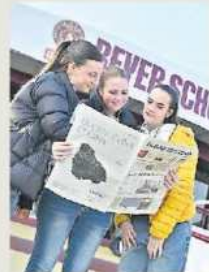
BINOMIO Il Gazzettino e RSC