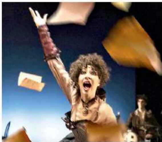
L'attrice Veronica Pivetti: domani a Mirano, venerdì a Portogruaro