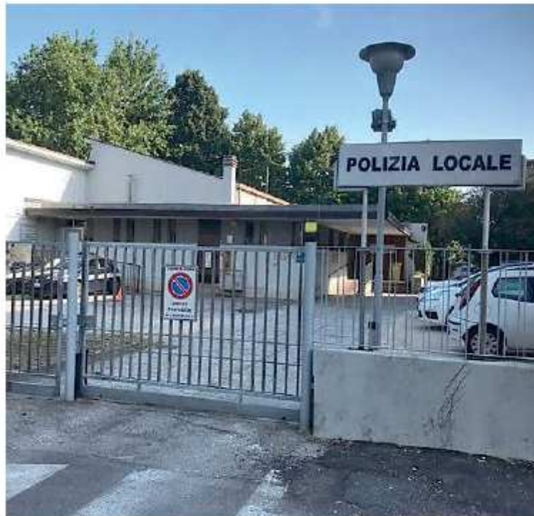
La sede della polizia locale di Spinea, in via Unità 51

L'uscita principale sarà quella dovuta al rientro delle funzioni di Polizia Locale e Protezione Civile con il recesso dall'Unione dei Comuni del Miranese, dal primo gennaio. I servizi torneran-