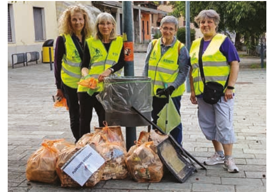
In foto: Plogging ladies dopo una raccolta di rifiuti

Di solito ci incontriamo alla Casetta dell'Acqua, nella piazza del mercato, e da lì ci muoviamo insieme verso la zona individuata. Quanto raccolto viene poi ritirato dagli addetti CEM.