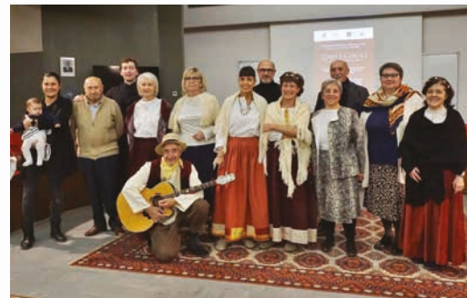
Nell'immagine uno degli incontri del progetto "Corti e Cortili"

Abbiamo inserito nell'elenco la "Curt da l'Albin" in Via Monte San Michele, adiacente alla "Curt Stopa", un cortiletto abitato solo da due famiglie ma di grande rilevanza, perché sede del Comune e delle scuole fino alla fine del 1800. Inoltre, stiamo valutando l'inserimento nell'elenco anche della "Curt dal Sacrista", denominazione popolare di un cortiletto con abitazione adibito a falegnameria con attigua la casa del "sacrista".