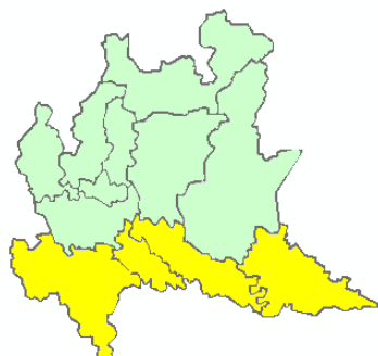
IERI MARTEDÌ 02/06