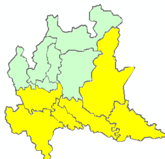
DOMANI GIOVEDÌ 04/06