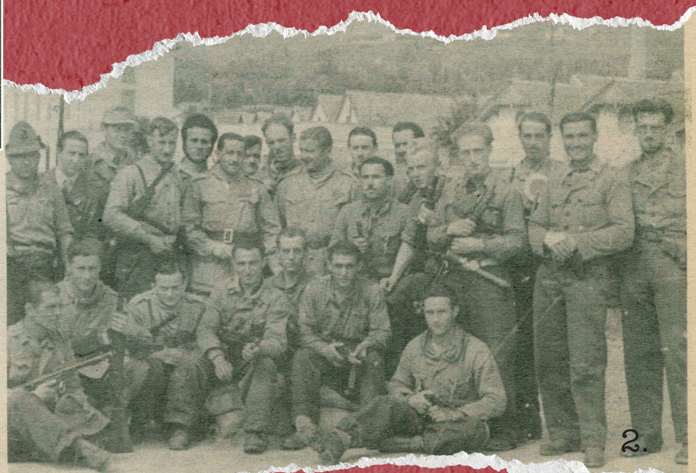
2. Partigiani del Battaglione Puecher alla Malpensata, Erba (Alta Brianza-Vento del Nord, aprile 1985).