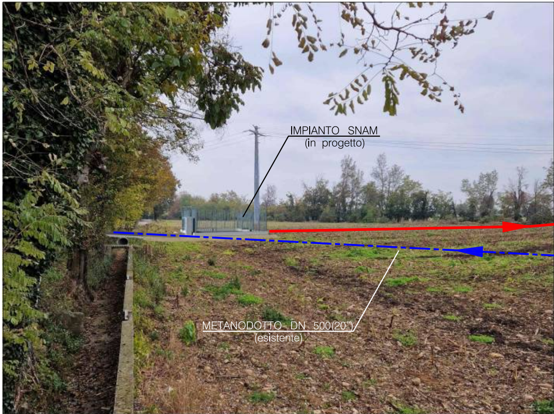
Vista del nuovo impianto iniziale in progetto a lato di Via Rogge.