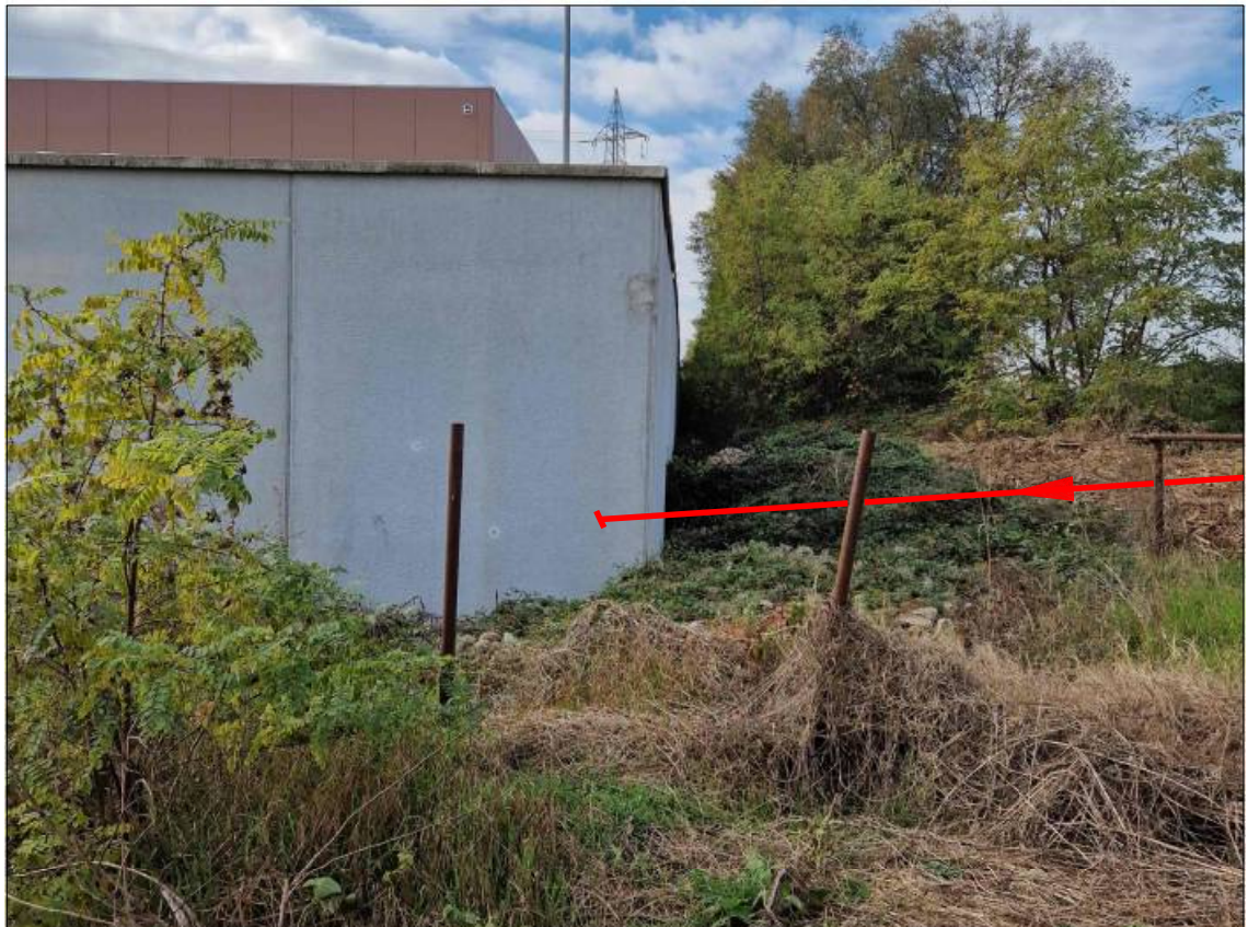
Vista del tratto terminale dell'allacciamento nell'area della ditta Gnutti.