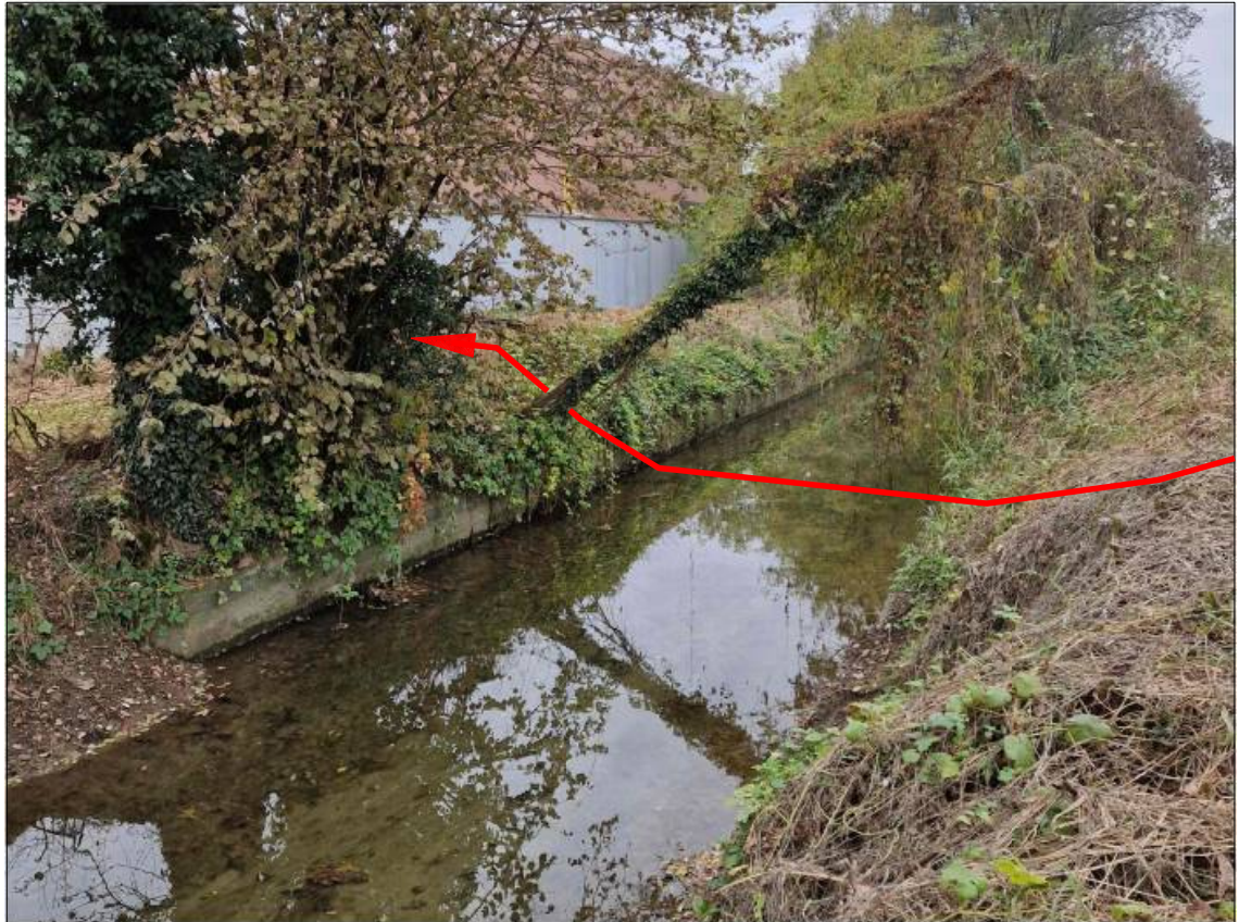
Vista dell'attraversamento della Roggia Bajona (con trivella/spingitubo).