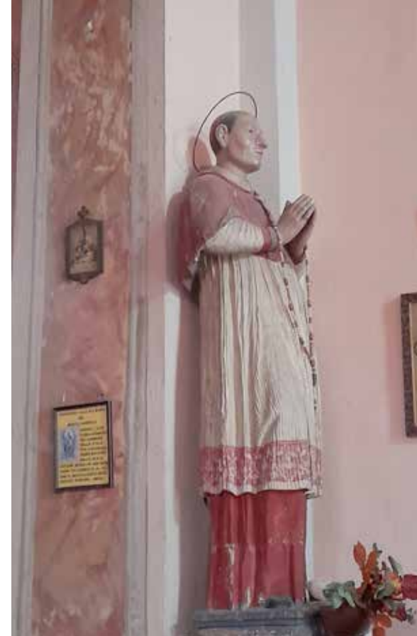
Statua al Chiesuolo di Santo Stefano lodigiano