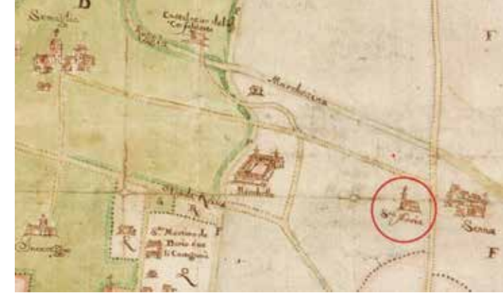
Mappa del '600 con l'indicazione della chiesa di Santa Maria