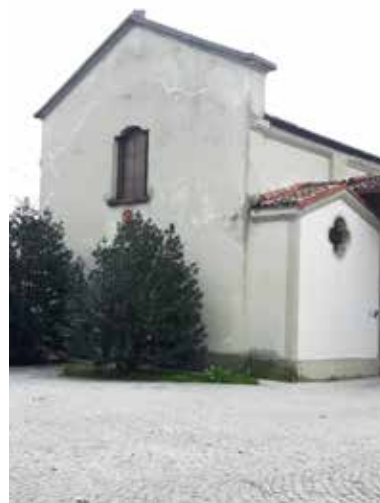
Oratorio di San Carlo e San Francesco alla Mulazzana

no, è ancora debitore al culto di S. Carlo: le chiese di Castiglione d'Adda, Quella di S. Bernardino e quella dell'Annunciata, presentano, in facciata, delle nicchie con statue del Santo, mentre numerosi dipinti sono testimonianza della forte figura del Vesco-vo: l'opera più antica che lo ritrae, databile intorno al 1620 è, con ogni probabilità, da individuare nel qua- dro raffigurante la Vergine col Bambino, S. Carlo e S. France- sco, conservata nella Chiesa di S. Biagio e della B.V. Immacolata di Codogno; il dipinto è collocato al di sopra di un altare accanto al quale, di recente, è stata individuata la scritta "Humilitas", motto del Santo. Tale opera viene attribuita a Daniele Crespi: tutta- via, i rimaneggiamenti subiti dalla tela, che risulta tagliata ai lati e, pertanto, senza firma, ne rendono difficile un inquadramento migliore. Quadri con la mede- sima iconografia si trovano nella Chiesa dei SS. Gervasio e