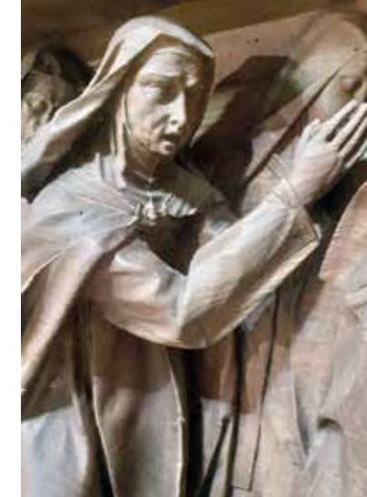
Transito di S. Teresa d'Avila, dettaglio

Nella Chiesa della B.V. Assunta di Somaglia, inoltre, sono presenti ben due dipinti che raffigurano il Santo: il primo, collocato su di un altare laterale, dedicato a S. Antonio da Padova, è un olio su tela che rappresenta il Borromeo in adorazione del Crocefisso, probabilmente per far cessare la pestilenza, come suggeriscono le figure in corteo alle sue spalle; di quest'opera, che proviene forse dalla soppressa chiesa di S. Giovanni alle