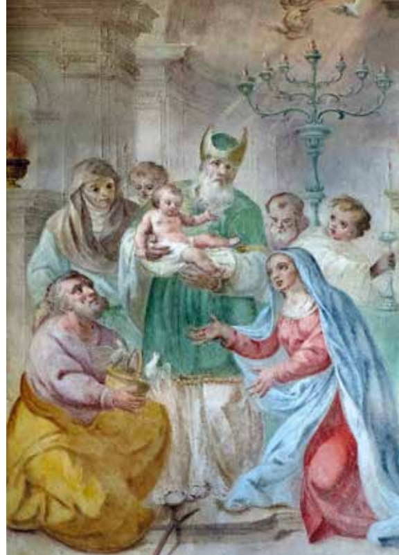
Affresco dell'Oratorio della purificazione alla Cascina Careggio

Sebbene non ci sia certezza sull'origine del nome "Careggio" - il termine dialettale "careg" indicherebbe la vegetazione palustre, secondo Fraschini, oppure un tipo di coltivazione, secondo l'Agnelli -, quella che è certa è l'antichità della cascina, che, stando ai documenti di possesso, esisteva già nel 1470; il fondo apparteneva in origine ai marchesi Pallavicini Trivulzio, più volte imparentati per matrimonio alla famiglia Cavazzi, con i quali si aprì una contesa proprio per il possesso dei beni di Careggio fra 1625 e 1626. Nonostante i Trivulzio compaiano come proprietari dei terreni fino al 1782, la cascina deve essere in qualche modo passata ai Cavazzi: questi ultimi, infatti, la cedettero nel 1973 agli attuali proprietari. Anco-