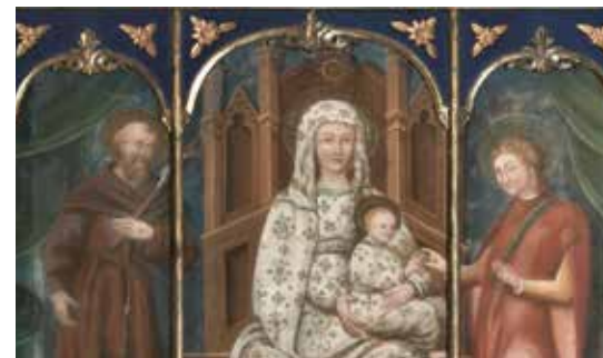
Affresco della Beata vergine delle Grazie

che l'emergenza non passò. I defunti venivano caricati su di un carretto e trasportati attraverso un sentiero che costeggiava la parte bassa di Senna, dal lazzeretto fino al cimitero vecchio, evitando di passare per il centro abitato. L'aver improvvisato un lazzeretto fuori dal centro abitato fece sì che il colera a Senna si diffondesse molto meno che altrove.