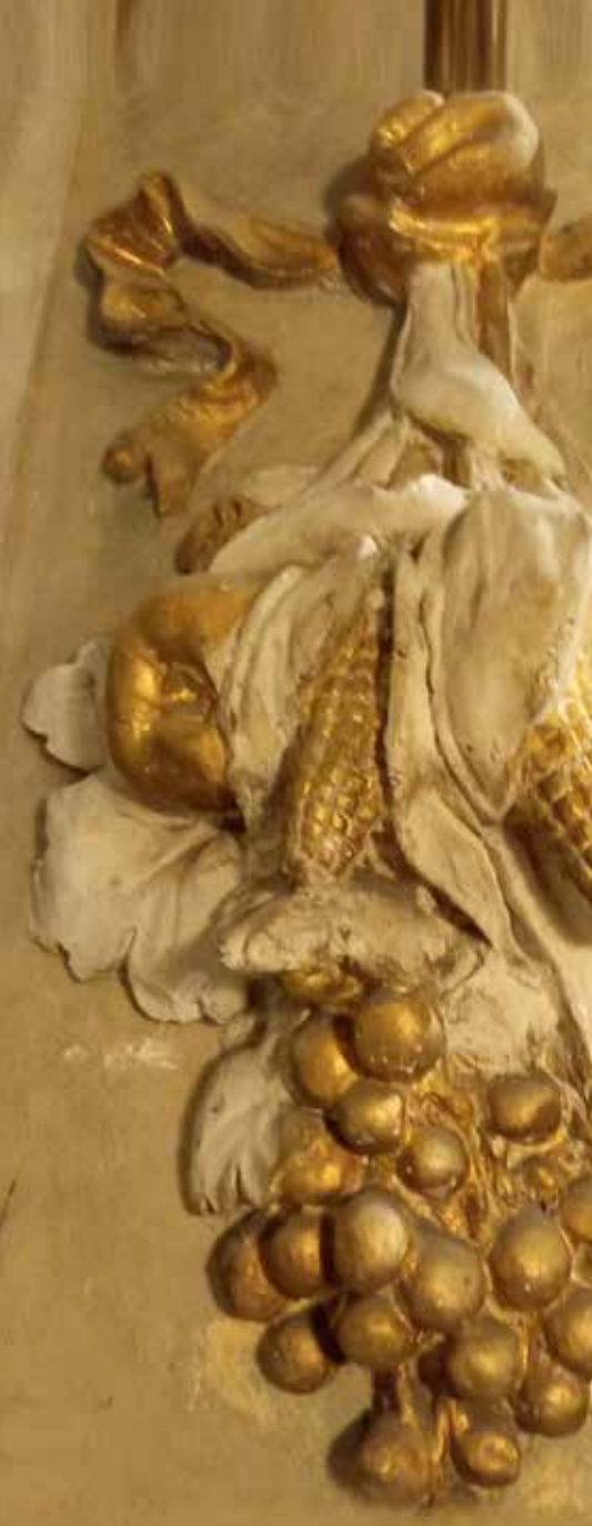
Fregio con mais, chiesa parrocchiale San Fiorano