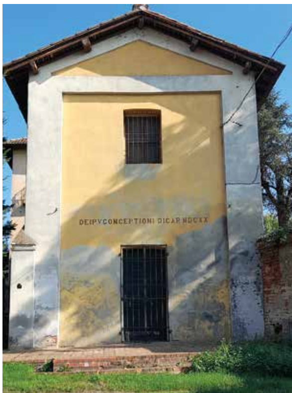
Oratorio B.V. Immacolata Coste della Chiesa