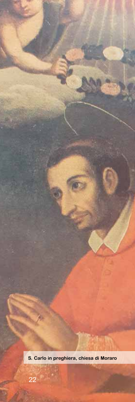
S. Carlo in preghiera, chiesa di Moraro