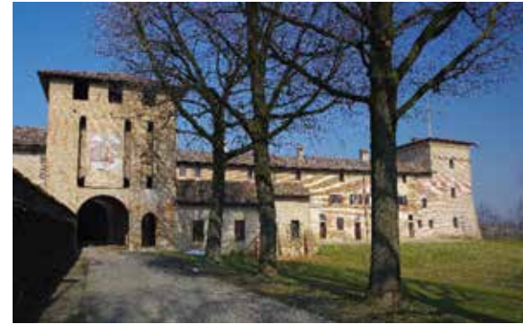
Castello Borromeo di Castelgerundo

Un valoroso antenato di Carlo era stato quel Vitaliano I Borromeo, generale degli eserciti di Filippo Maria Visconti, che aveva fatto erigere un castello dopo essere stato nominato, nel 1440, signore e feudatario dell'antico borgo di Camairago. Nell'atto di nomina Filippo Maria Visconti rimarcava la licenza di fortificare il piccolo borgo, il quale aveva perduto l'originario castello che era stato distrutto dai milanesi nel 1158 durante la guerra combattuta contro la città di Lodi. Il nuovo feudatario aveva intrapreso quindi la costruzione di un grande edificio a pianta rettangolare, dotato di torri e ponte levatoio, sia per dimostrare il prestigio raggiunto dalla casata che per agevolare manovre militari a protezione delle città di Lodi e Milano. Di fatto i soldati dei Borromeo non avanzarono mai da Camairago per la difesa di Lodi ma il castello fu testimone degli scontri del 1547 fra Francesco Sforza e i veneziani. Nel XVI subì l'attacco e l'occupazione delle truppe francesi e nel 1629 patì il passaggio dei lanzichenecci che assediavano Roma. Un'ulteriore occupazione andò in scena allorquando nel