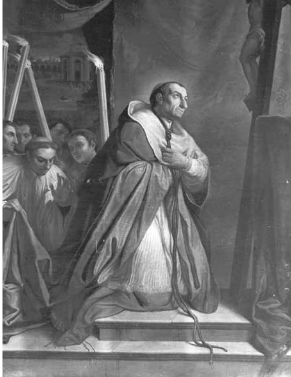
San Carlo Borromeo in adorazione della Croce

Negli anni della sua instancabile attività Carlo Borromeo, che si era laureato in legge all'Università di Pavia, gestì il patrimonio edilizio della diocesi con pragmatismo e sistematicità. Fu un meticoloso committente di opere e restauri: chiedeva ai suoi architetti rilievi in scala e pretendeva garanzie sulla copertura economica delle opere da realizzare. Era attento alla distanza di sicurezza da fiumi e torrenti, in modo da poter difendere le chiese dalle periodiche esondazioni, come pure al decoro degli edifici: con assiduità venivano emanate sue circolari di istruzioni ai parroci e ai prevosti anche delle più lontane campagne affinché potessero conformare le costruzioni secondo modelli omogenei. Nel mirino dell'Arcivescovo non c'era solo il cattivo stato di conservazione degli edifici religiosi; anche la gestione disattenta e i garbugli di carattere