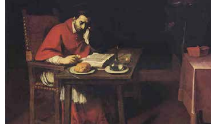
Digiuno di san Carlo Borromeo, olio su tela (Daniele Crespi) chiesa di Santa Maria della Passione, Milano.

sto approfittando della sosta per scrivere lettere. Nella Lombardia dell'epoca venivano cucinate farinate di miglio e segale, la polenta era fatta con grano saraceno (la polenta bigia citata da Manzoni nei Promessi Sposi). Ci sarebbe voluto ancora qualche decennio per impiantare la coltivazione di mais che da poco era giunto dall'America e che avrebbe sostituito tutti gli altri cereali nell'alimentazione della popolazione di pianura. La segale cresciuta in clima umido era tossica, ma all'epoca nessuno lo sapeva, perché all'interno proliferava un fungo che dava alla spiga una forma arcuata (da qui il nome di segale cornuta) contenente sostanze allucinogene. Mangiare pane di segale contaminato portava a cefalee, nausea, disturbi visivi; un quadro sintomatico che all'epoca veniva associato alle persone possedute dal demone e che pertanto dovevano essere esorcizzate. Non solo, dato che queste intossicazioni potevano riguardare intere comunità locali,