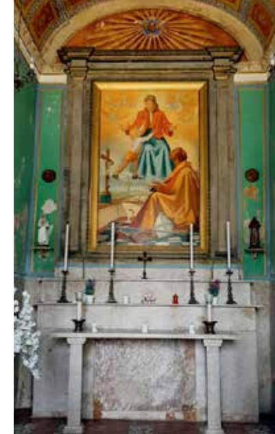
Affresco Madonna della Fontana

"Un giorno nel mese d'agosto dell'anno 1681... sgorgò questa sorgente... quest'acqua era fresca, anzi fredda e leggera... molti andavano e ne portavano via in quantità alcuni nel lavarsi e bere di quest'acqua si sanavano d'alcuni mali... e ancora di febbri terziane e quartane..."