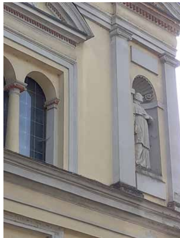
Chiesa di San Bernardino, Castiglione d'Adda

Accanto agli oratori, che ospitano sedute per i fedeli, compaiono, sul territorio, alcune cappelle dedicate al Santo, come la Cappellina dell'Abbazia, presso l'omonima cascina, sempre a S. Stefano Lodigiano, ove compa-