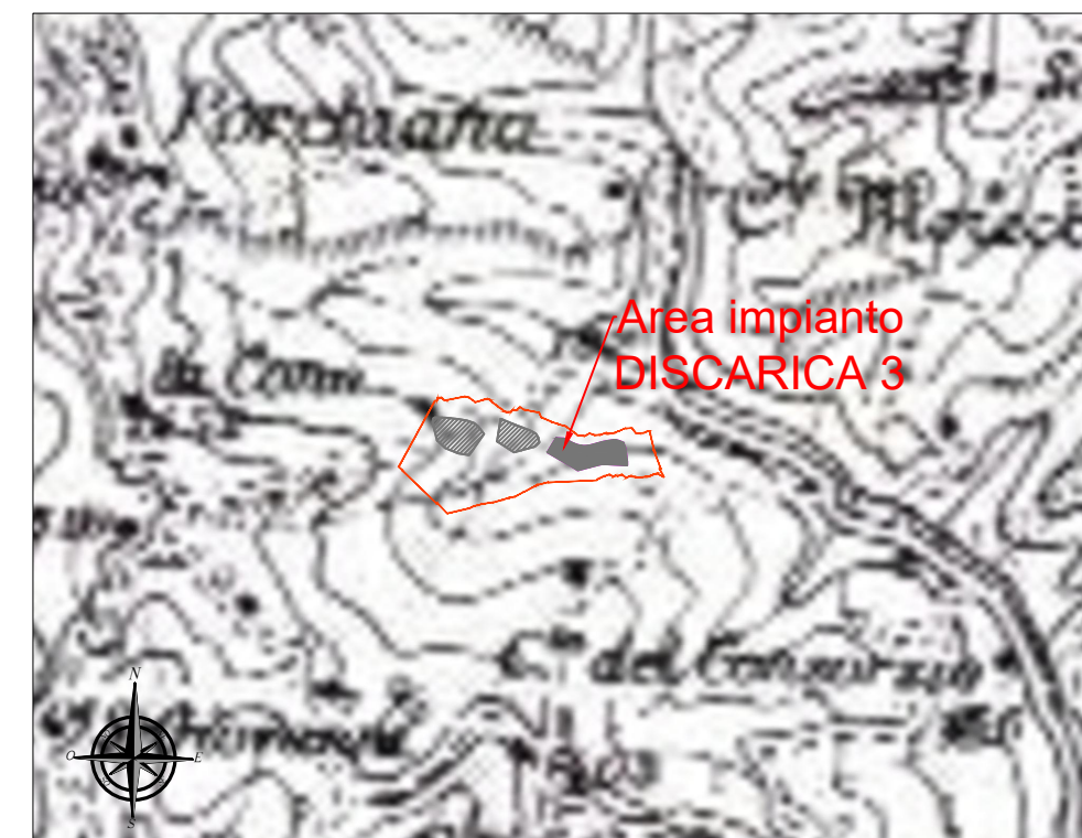
Centri e nuclei storici - Paesaggio agrario storico (Tav. 8 PPAR)