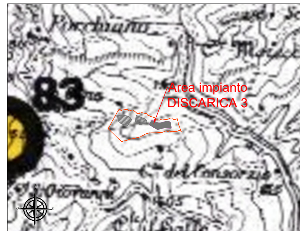
Luoghi archeologici e di memoria storica (Tav. 10 PPAR)

LOCALIZZAZIONE DEGLI EDIFICI E MANUFATTI