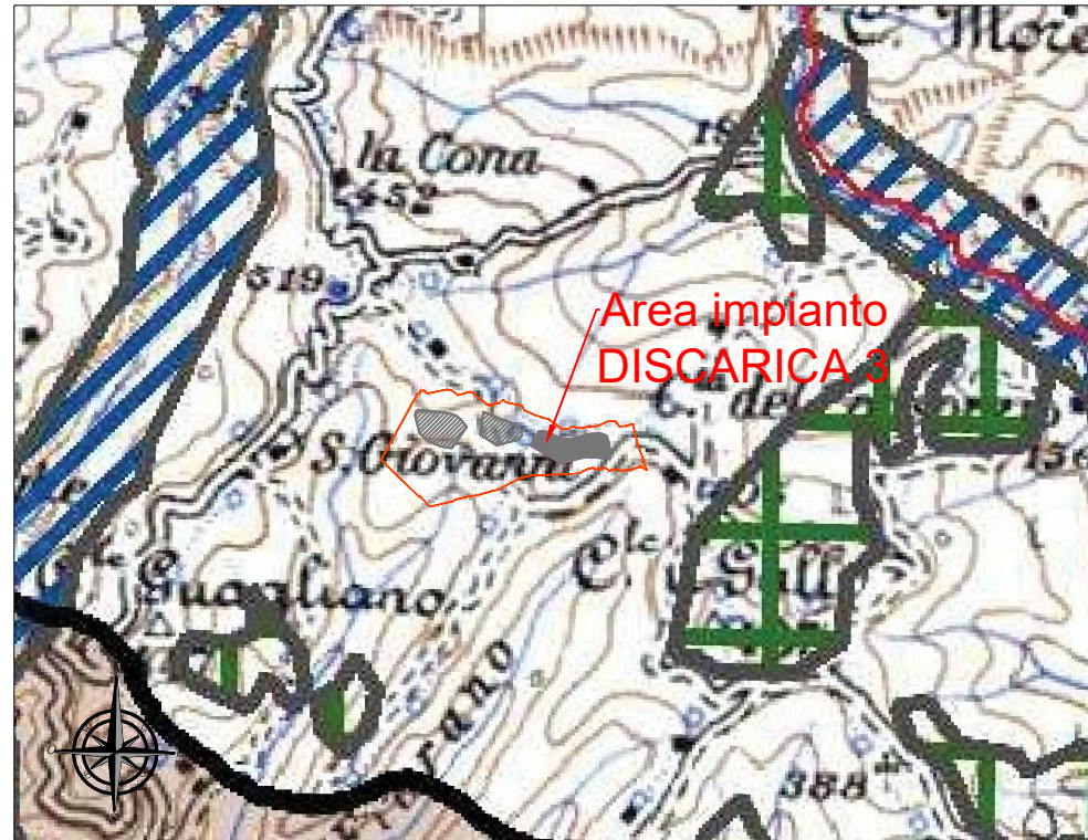
Vincoli non escludenti - Vincoli paesaggistici (Tav. 1 PPAR)