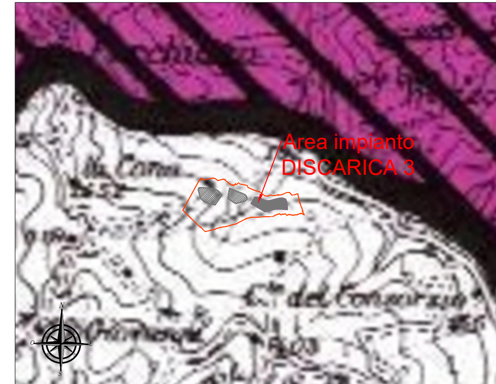
Aree per rilevanza dei valori paesaggistici e ambientali (Tav. 6 PPAR)