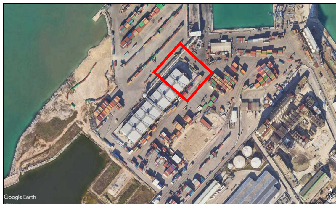
INDIVIDUAZIONE AREA OGGETTO D'INTERVENTO