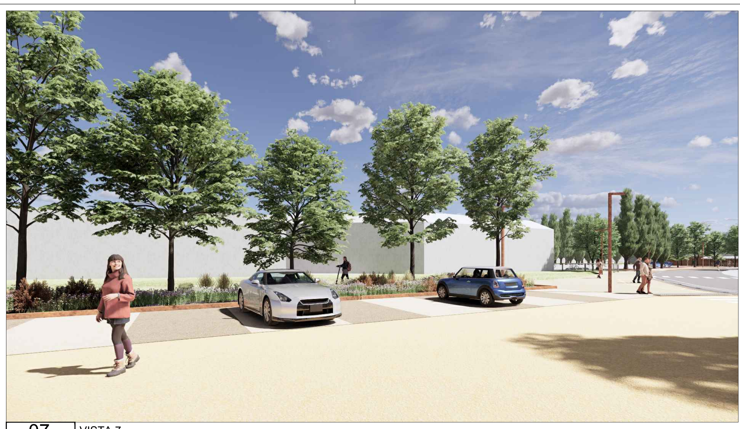
07 VISTA 7