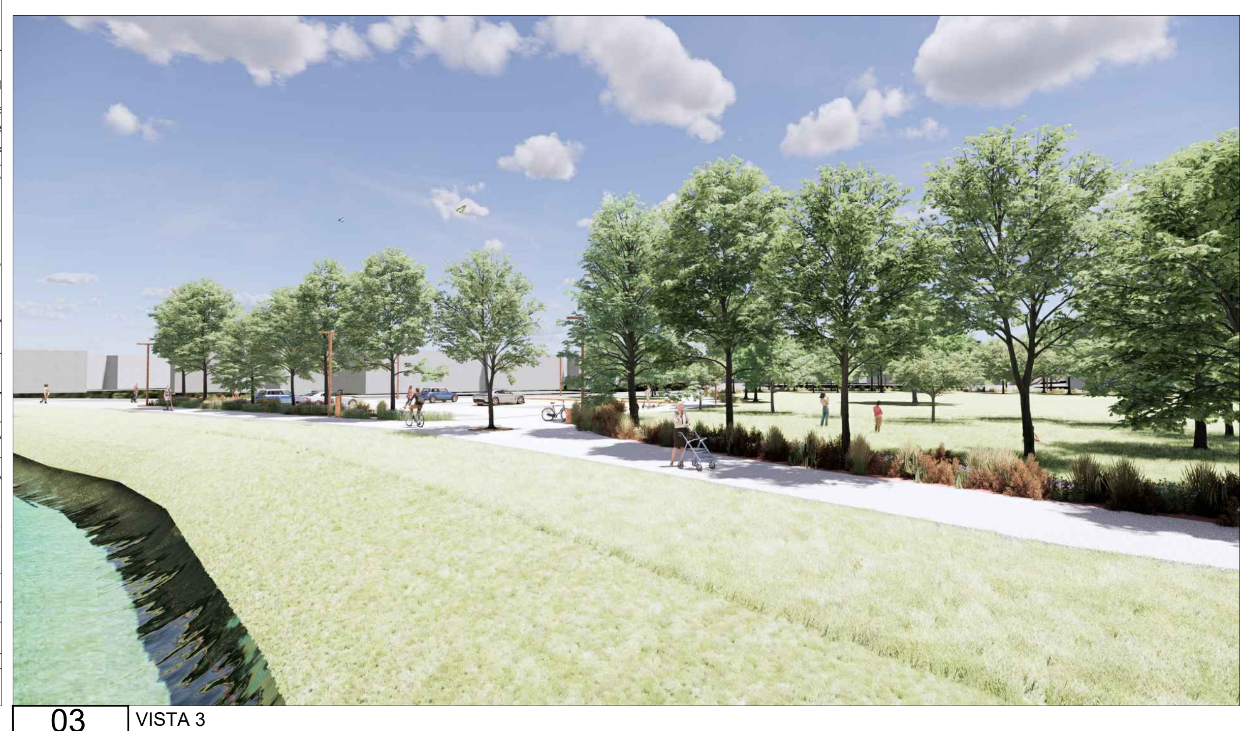
03 VISTA 3