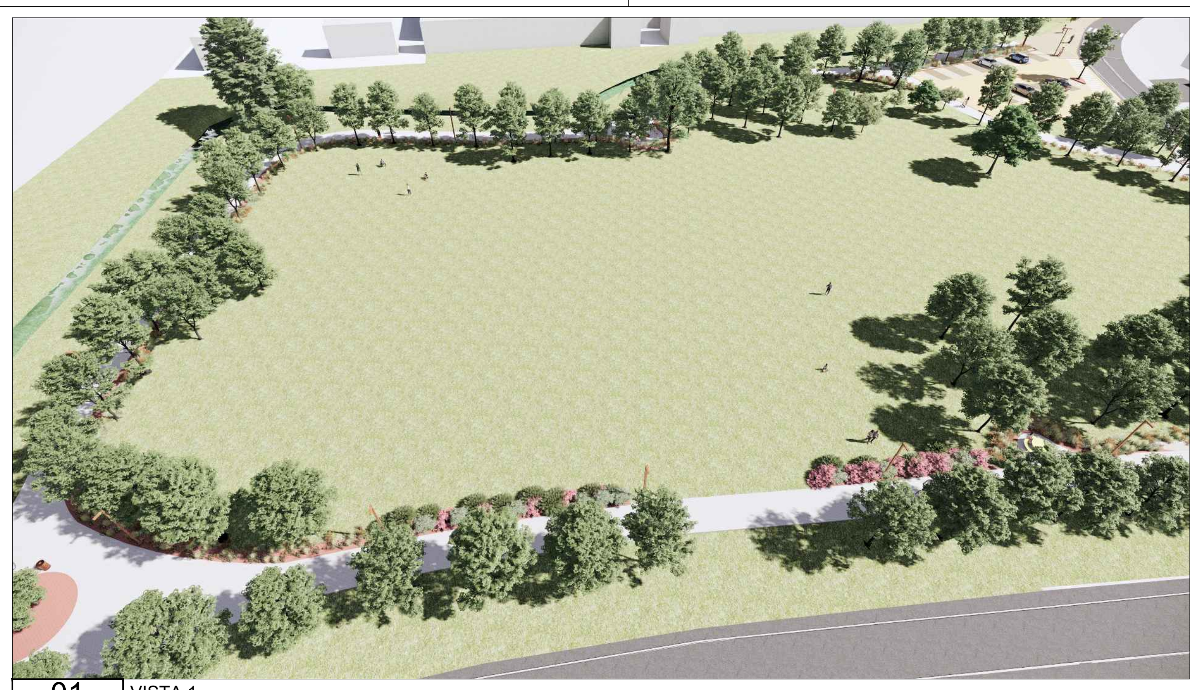
01 VISTA 1