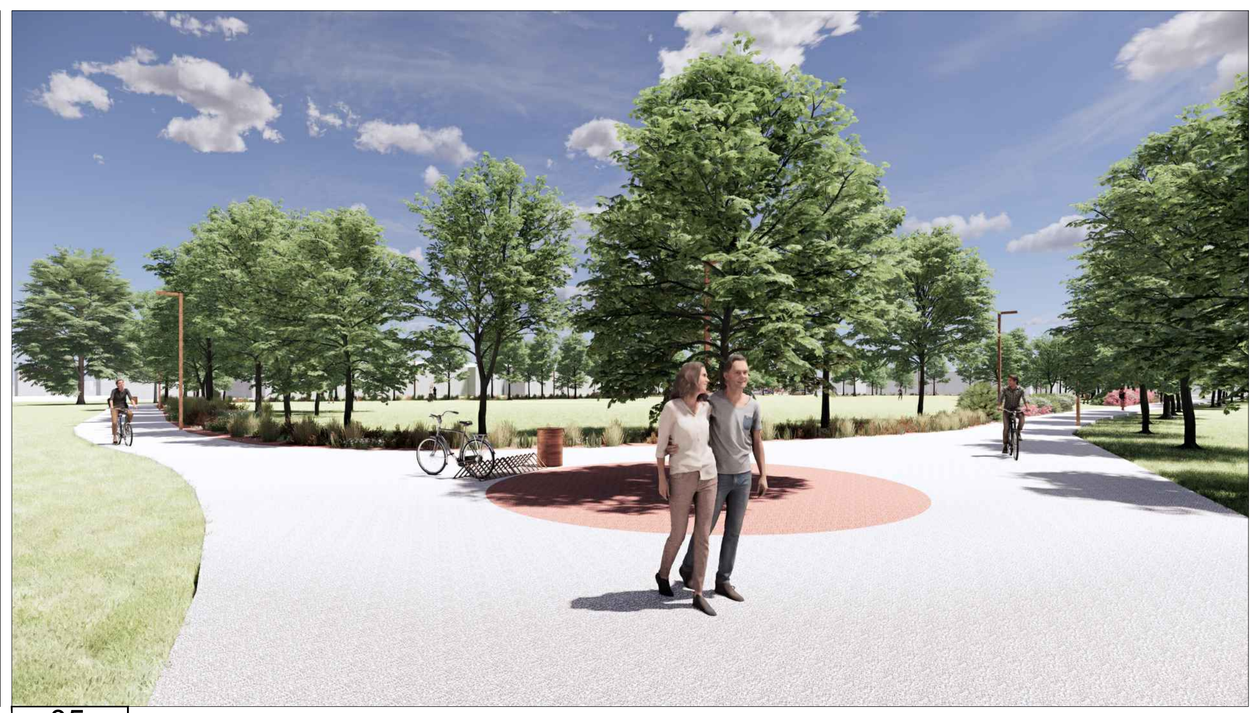
05 VISTA 5