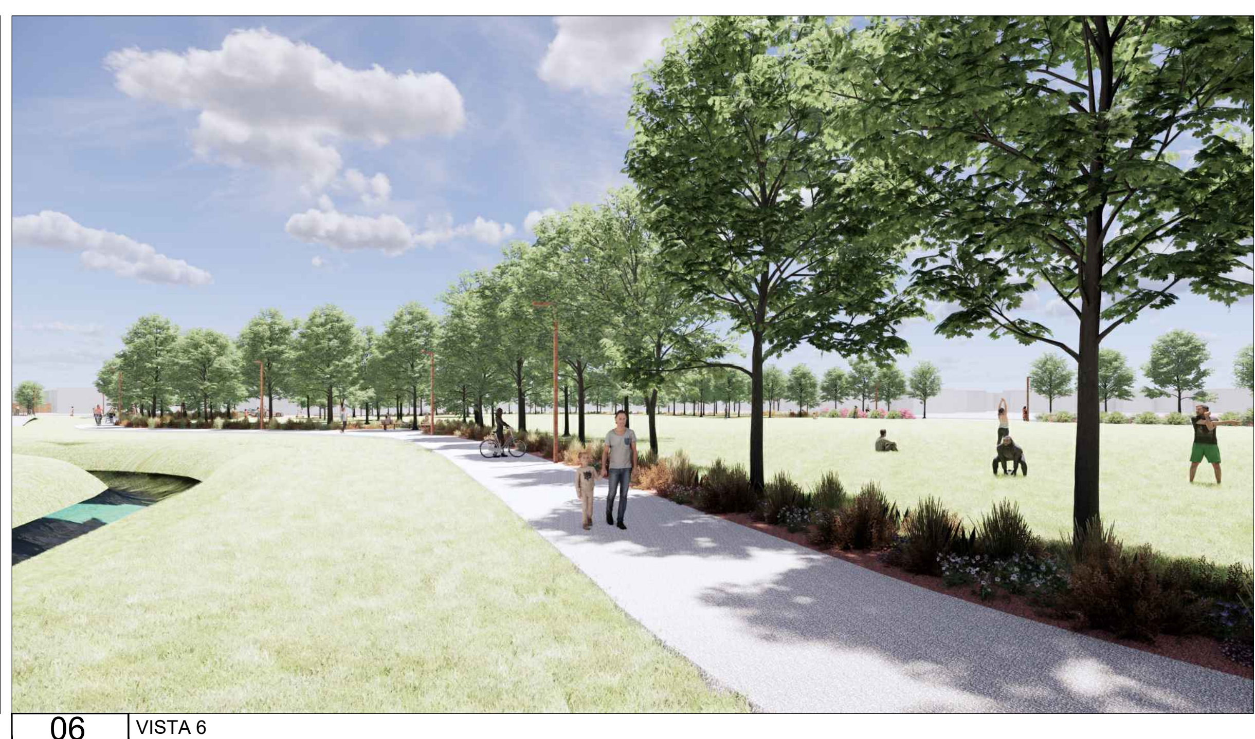
06 VISTA 6