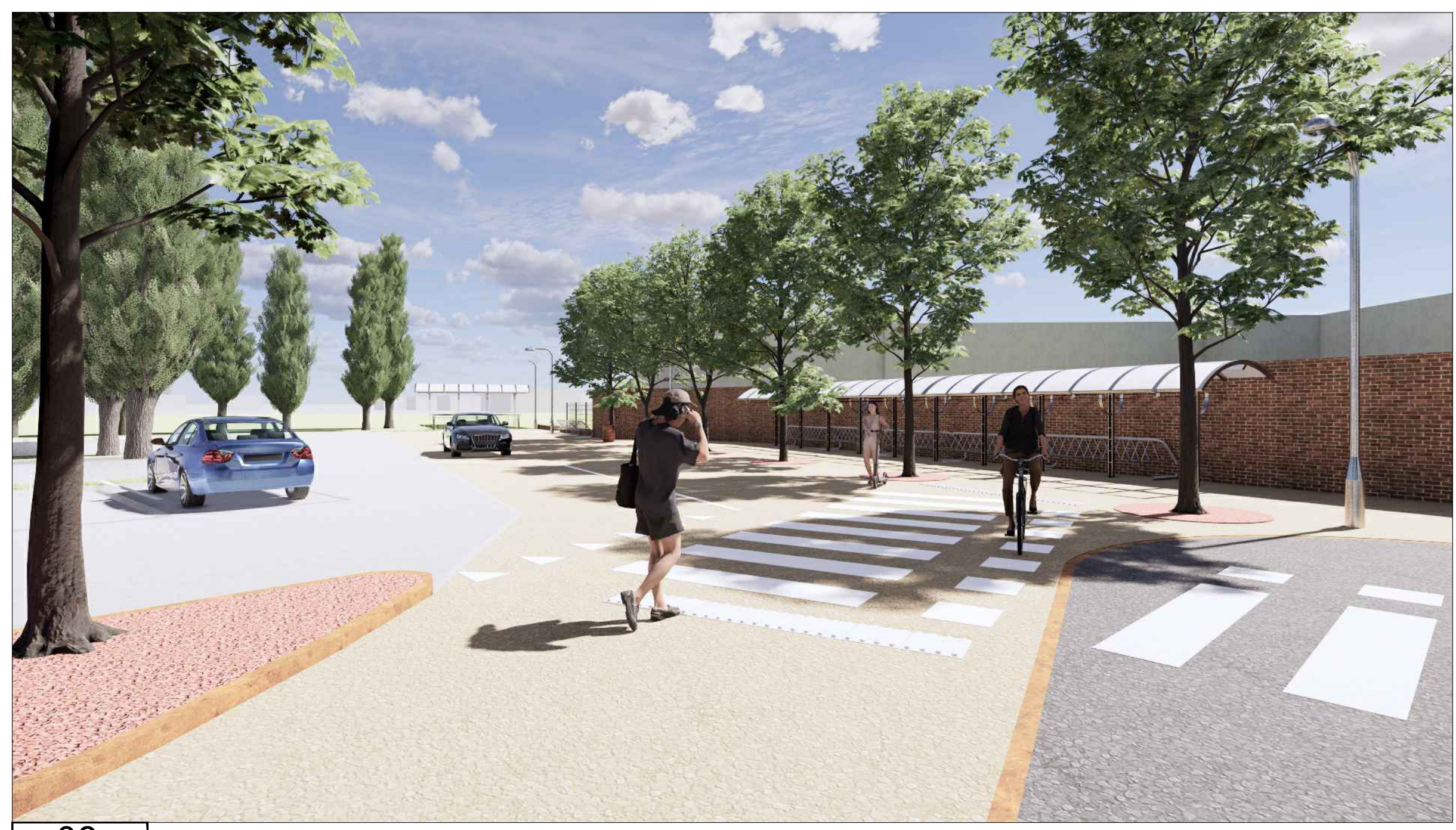
08 VISTA 8