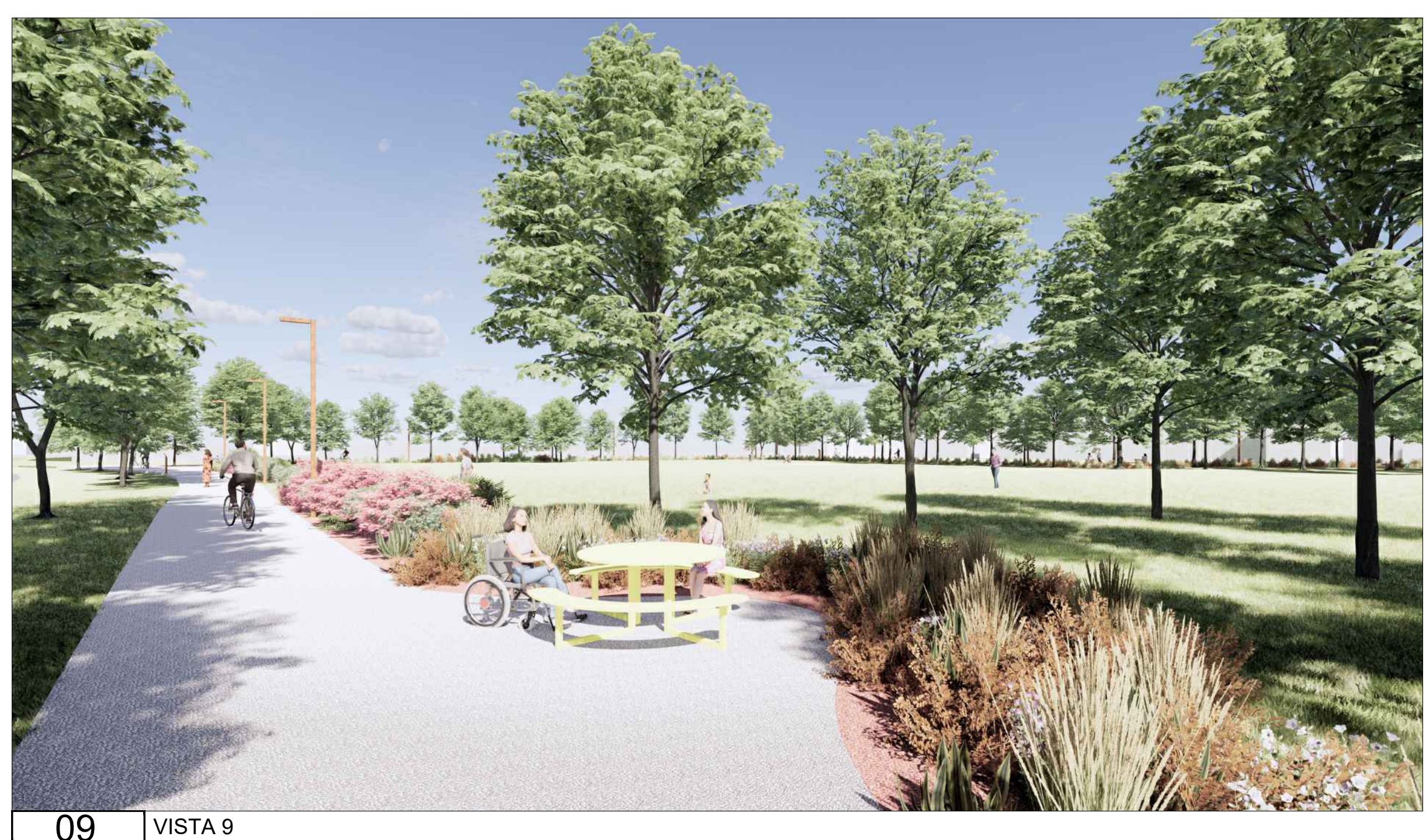
09 VISTA 9