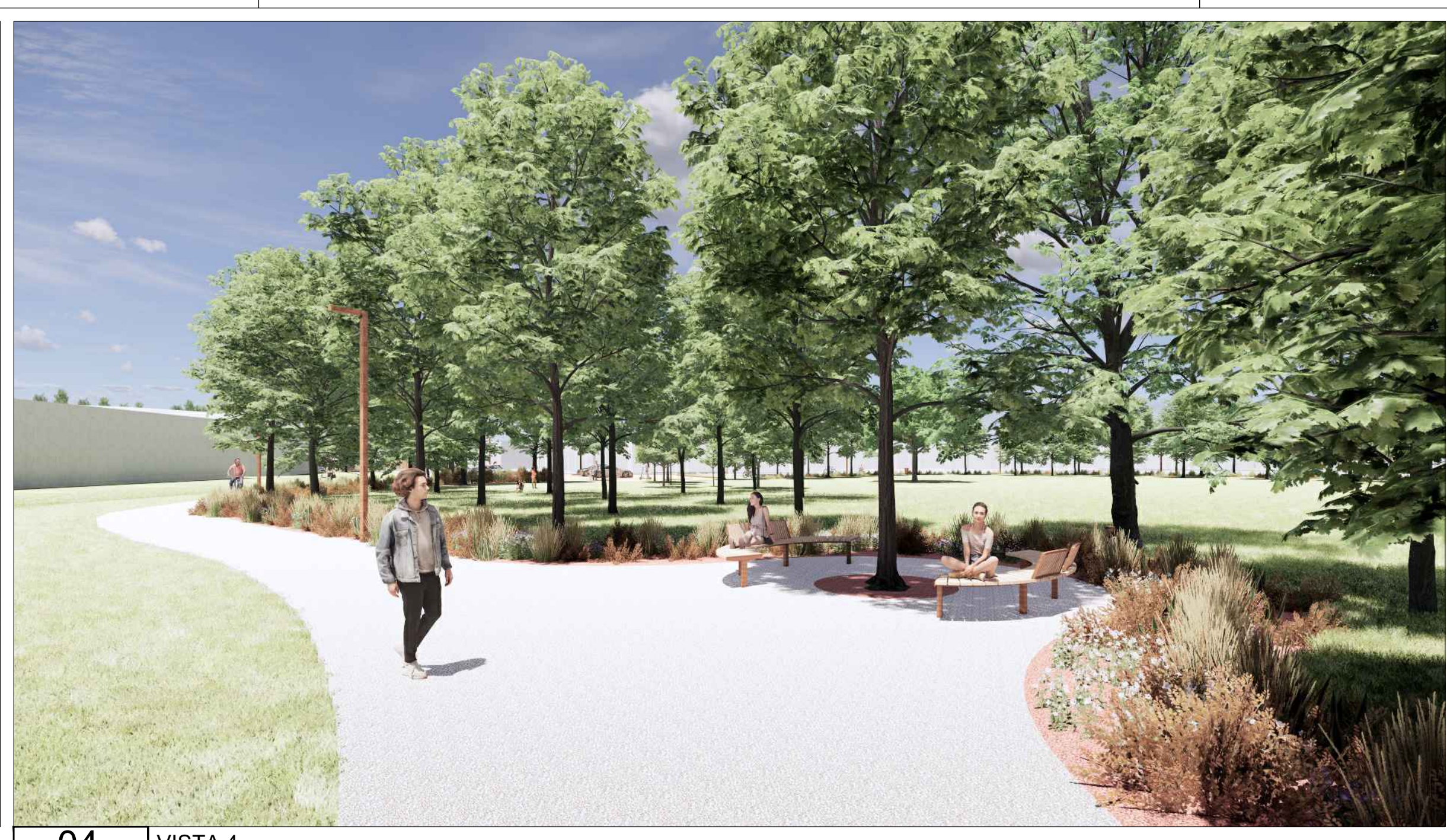
04 VISTA 4