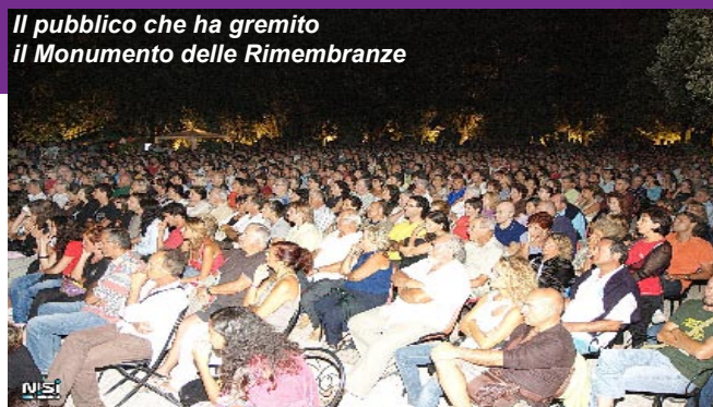
Il pubblico che ha gremito il Monumento delle Rimembranze