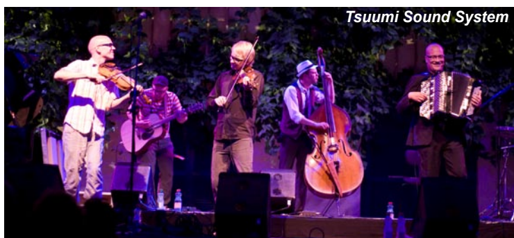
Tsuumi Sound System

il suo calore cittadini e visitatori all'insegna della musica dal vivo. Occhio ai siti web www.castelfidardo.it e www.festivalcastelfidardo.it .