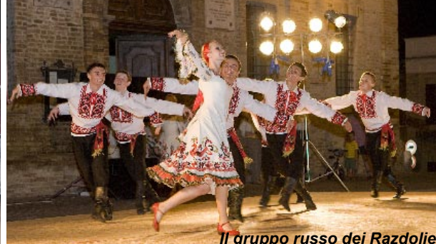
Il gruppo russo dei Razdolie