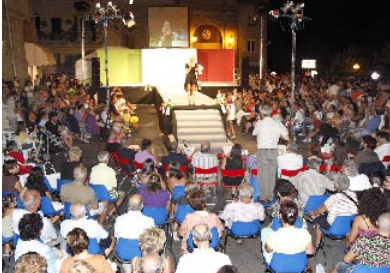
Il pubblico a Porta Marina