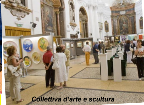
Collettiva d'arte e scultura