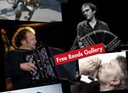
Free Reeds Gallery