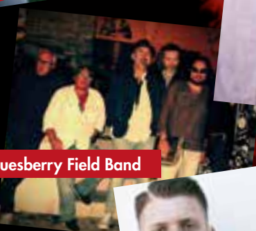
Bluesberry Field Band