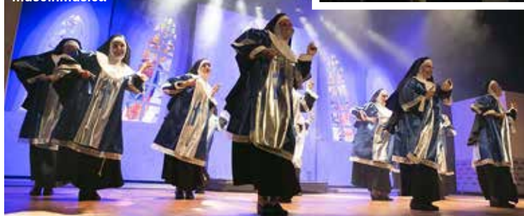
La notte della musica