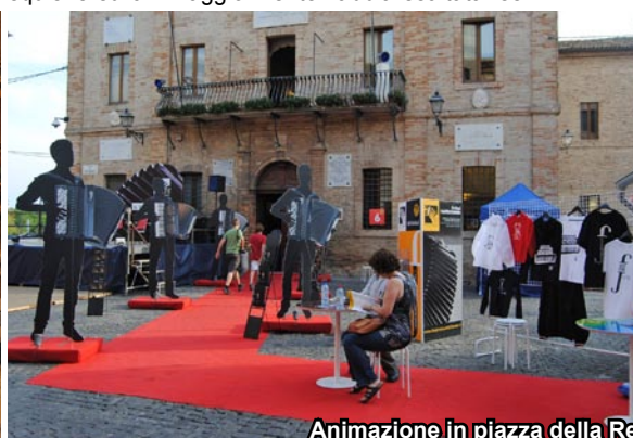
Animazione in piazza della Repubblica