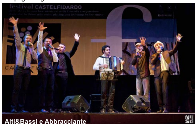
Alti&Bassi e Abbracciante

gli ospiti di grande impatto che si sono alternati sul palco dell'Astra dando vita a combinazioni esplosive (il gruppo a cappella degli Alti&Bassi e la "voce d'oro" Abbracciante, la dirompente BandAdriatica, i maestri di clarinetto e fisarmonica Mirabassi e Carstensen) o ciascuno dei singoli concorrenti che con dedizione la studiano. Ma certo è che lo sforzo di Amministrazione Comunale, Pro Loco e Studio Ideazione ha raggiunto lo scopo: Castelfidardo è la capitale internazionale della fisarmonica, la fisarmonica è Castelfidardo.