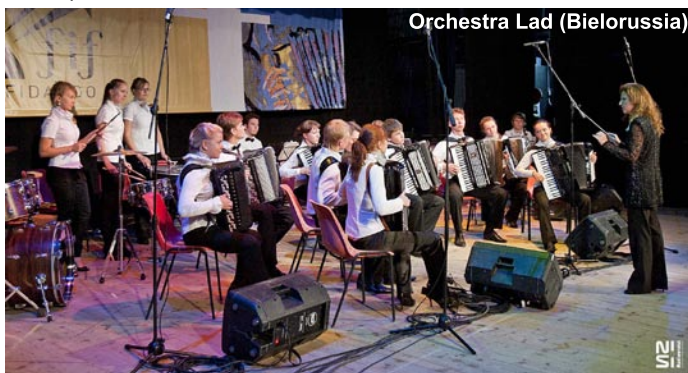
Orchestra Lad (Bielorussia)

■ E' salita sul palco dell'Astra ammaliando una platea multietnica per assistere alle serate di gala e agli eventi collaterali del Festival, nella cinque giorni internazionale tributo della sua patria. L'abbiamo vista aprirsi e richiudersi in un'infinità di stili, varianti